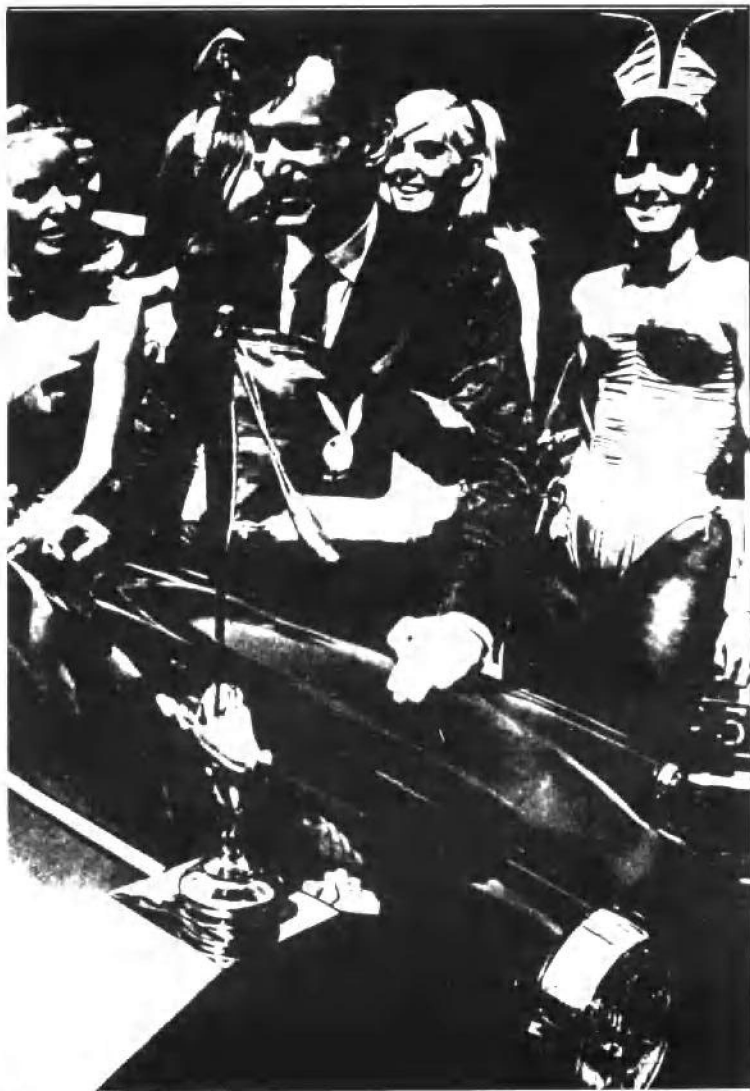
赫夫纳与他的劳斯莱斯