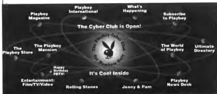
花花公子在全球的网址