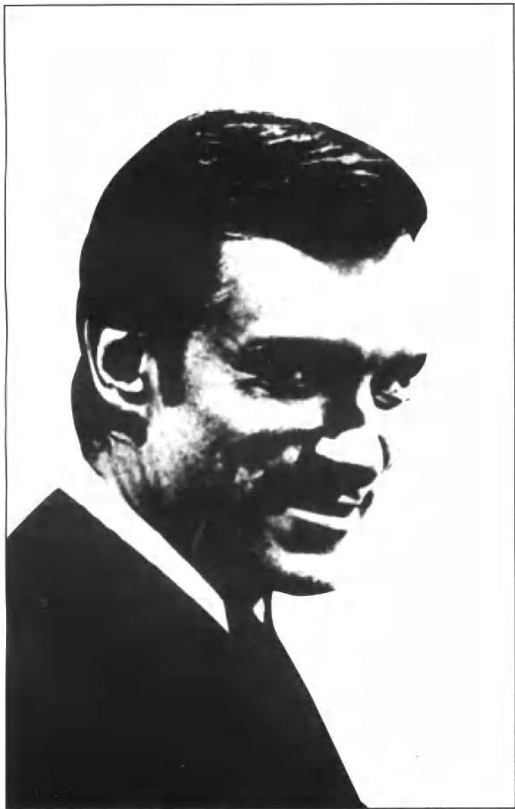
花花公子创始人休·曼·赫夫纳