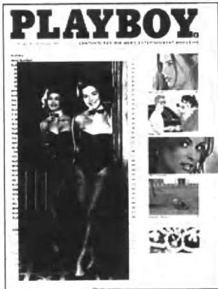
花花公子的《娱乐圈》画报