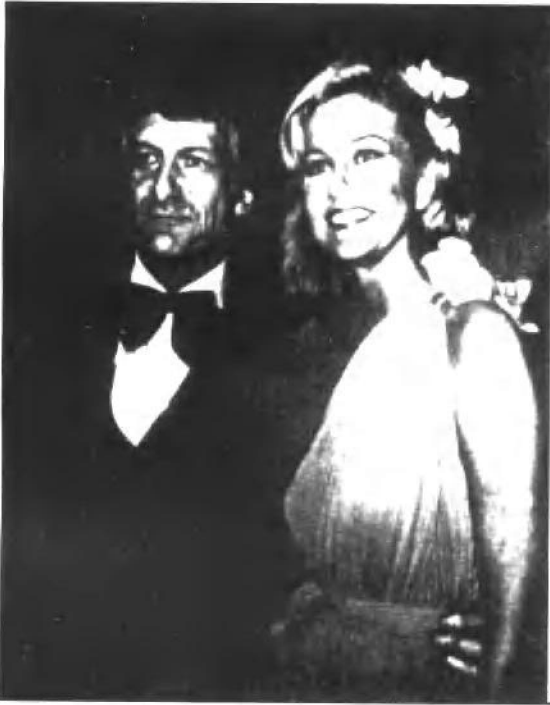
赫夫纳和他的女友芭比·本顿