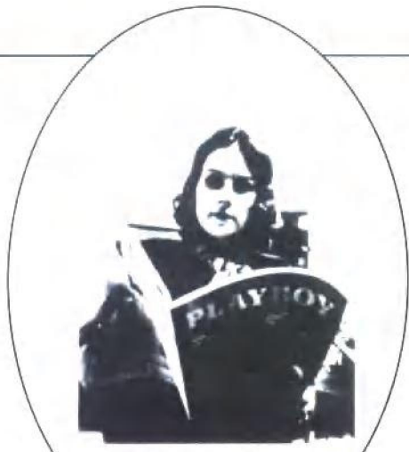
花花公子现任总裁克里斯汀·赫夫纳