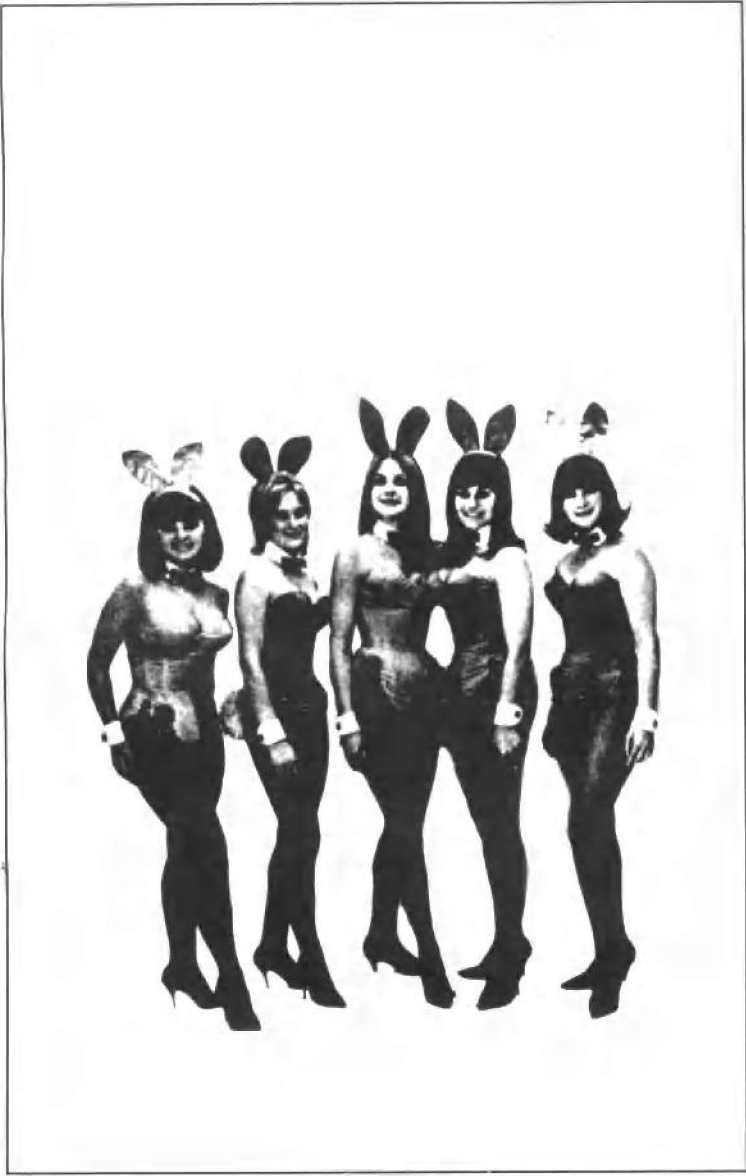
受训归来的“兔女郎”