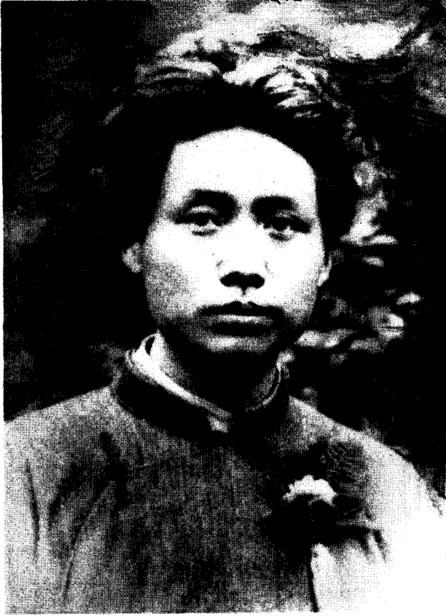
一九二四年在上海