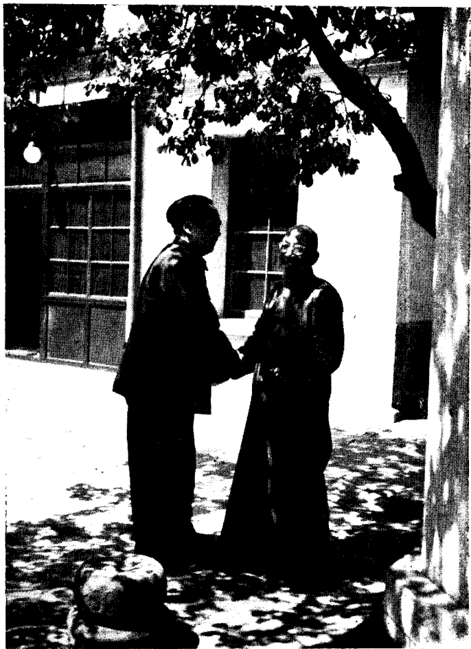
一九四九年初夏和柳亚子在北京香山双清别墅