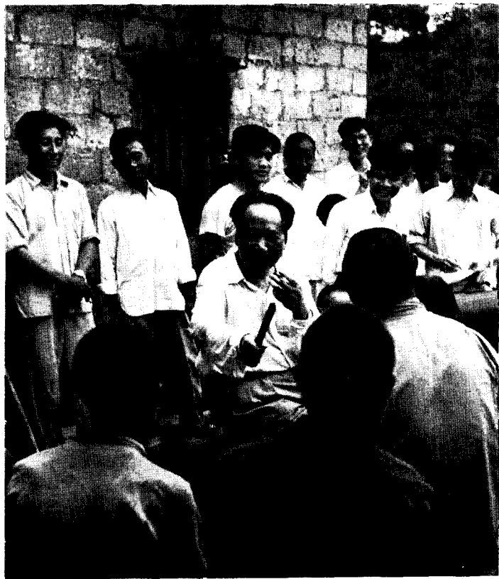
一九五九年六月在韶山同农民亲切谈话