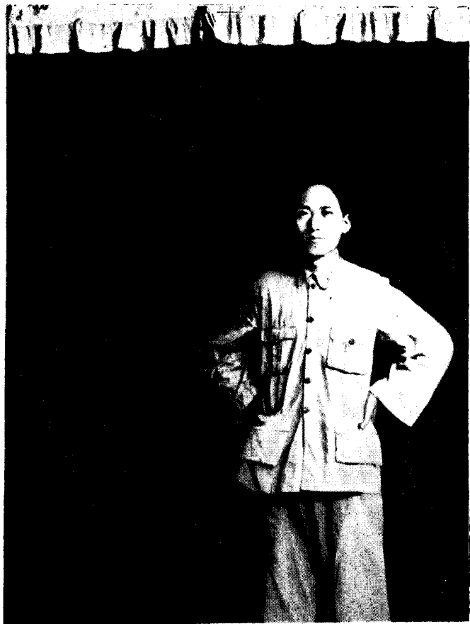
一九三三年在贛南，閩西八县贫民团代表会议上