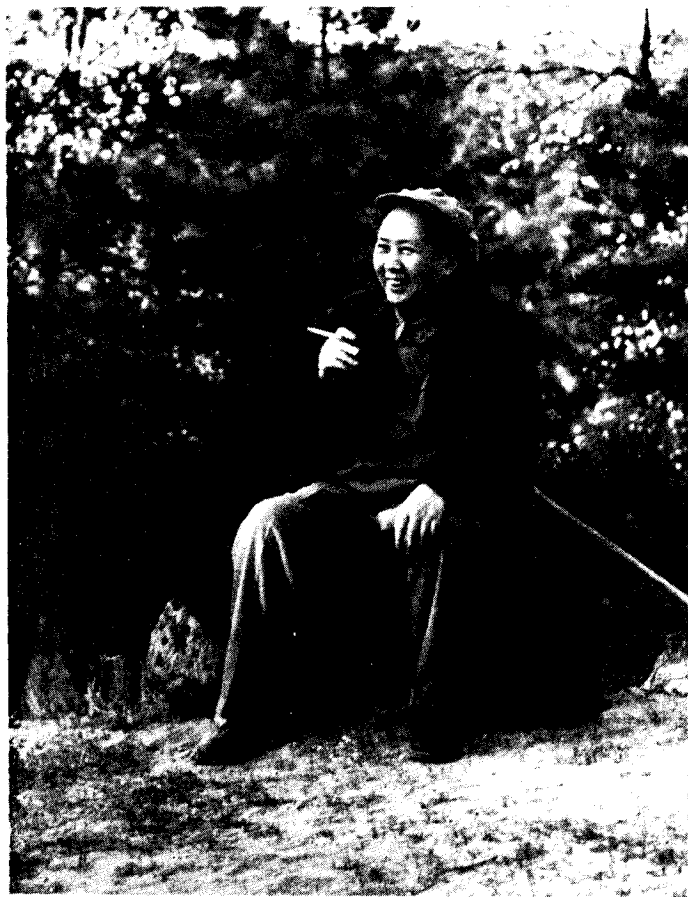
一九五四年在北戴河