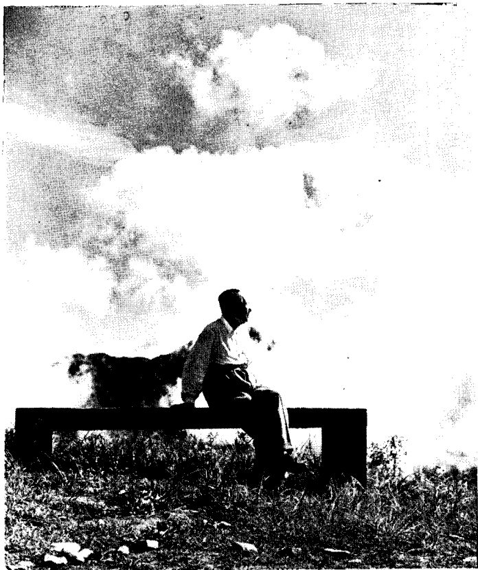
一九六一年八月在庐山