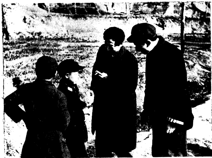
一九三九年五月和萧三在延安杨家岭