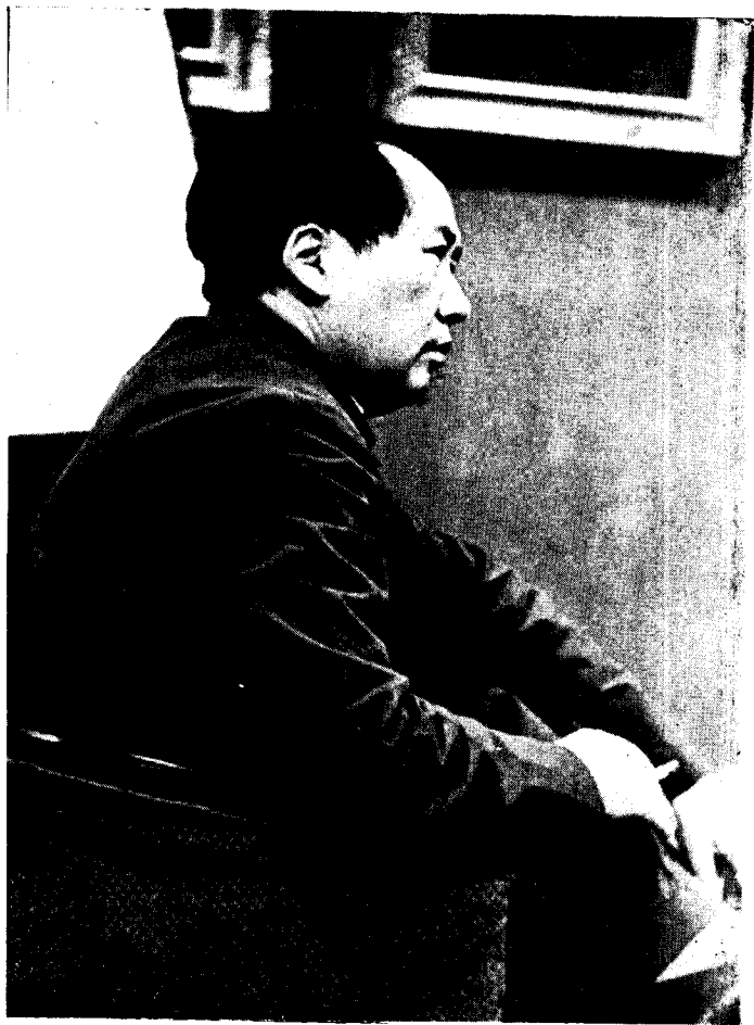
一九四九年在中华全国文学艺术工作者代表大会上