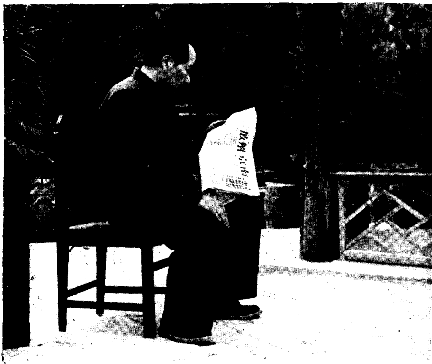
一九四九年四月在看解放南京的胜利消息