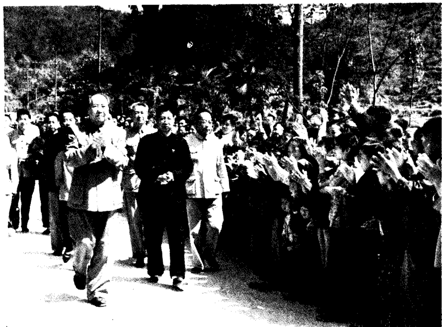
一九六五年五月在井冈山