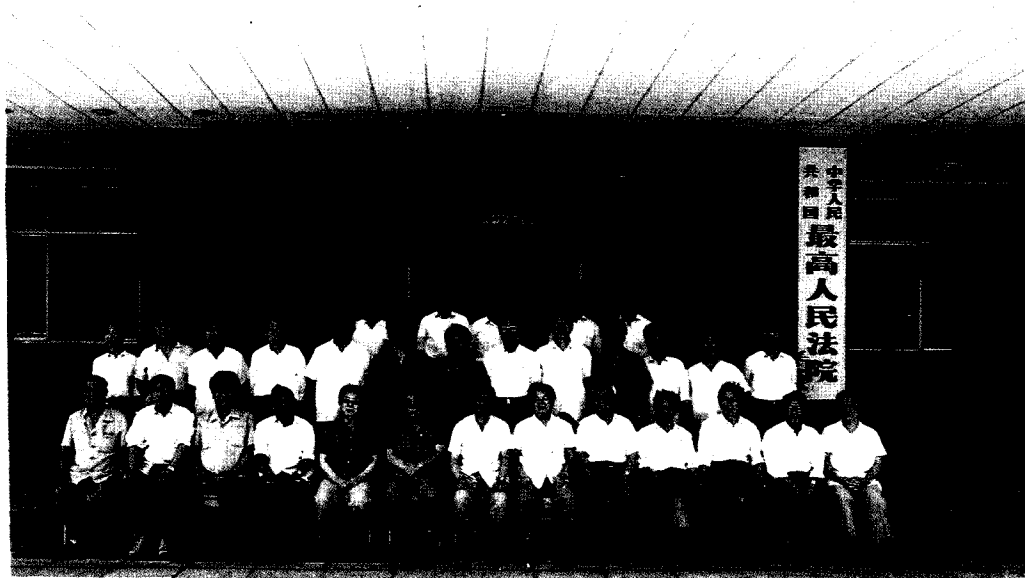
▲1991年6月29日,最高人民法院领导接见参加中央党校第八期学习的法院系统学员,并合影留念。