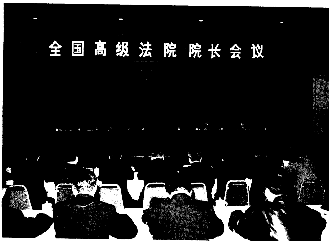
▲1991年1月7日,全国高级法院院长会议在北京隆重开幕。