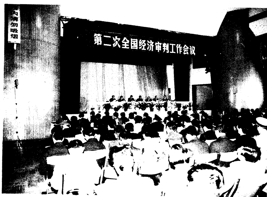
▲第二次全国经济审判工作会议于1991年5月6日在南京市召开。