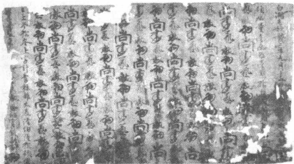
图二 唐神龙二年（公元706年）白涧屯纳官食粮帐