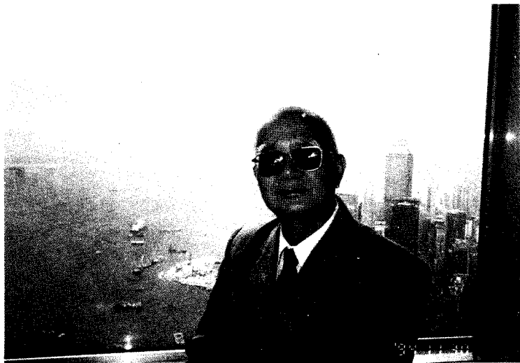
作者于1994年11月在香港