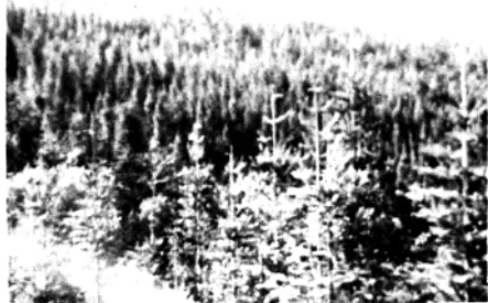
一望无际的杉树林