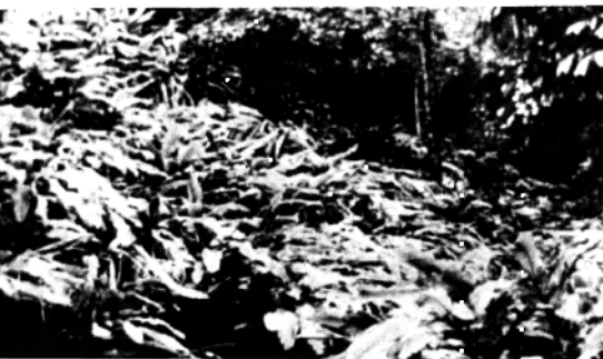
浓荫复盖的苹果山