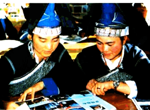
傣族青年在阅览室