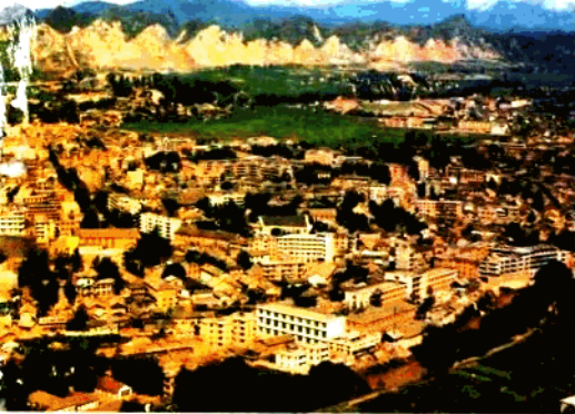
自治州首府文山城一角