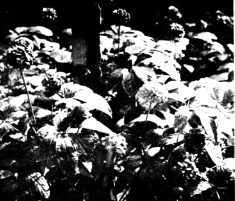
名贵药材三七是自治州的著名特产