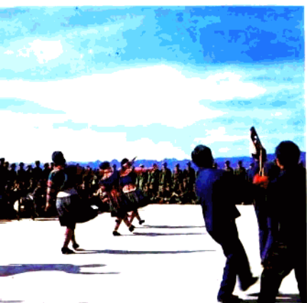
慰问边防战士（苗族《斗鸡舞》）