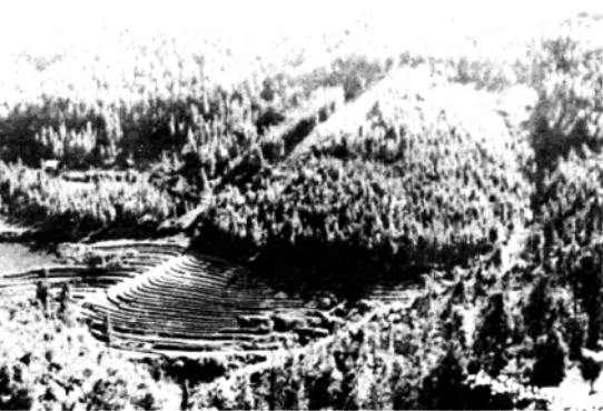
香飘万里的八角林