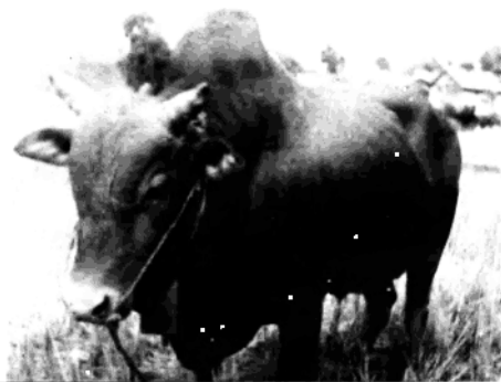
著名的 广南高峰黄牛