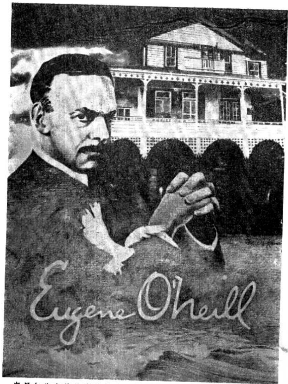
奥尼尔像和他的亲笔签名。背景是他父亲在新伦敦的“基督山伯爵”别墅，《漫长的旅程》的故事就发生在这里。