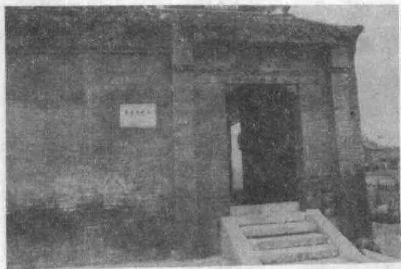
朱东润故居。1982年献给泰兴县人民政府，现为泰兴县图书馆。