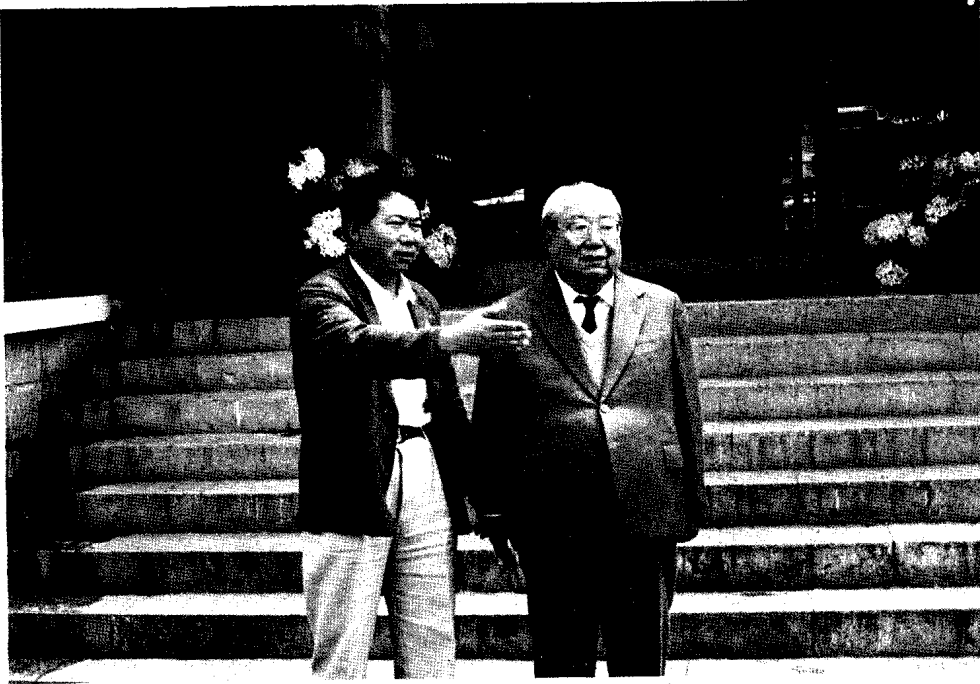
全國人大副委員長費孝通在石林賓館 (1990.6.4)

Fei Xiaotong, Vice Chairman of the National People's Congress, at Stone Forest Hotel (4 June, 1990)