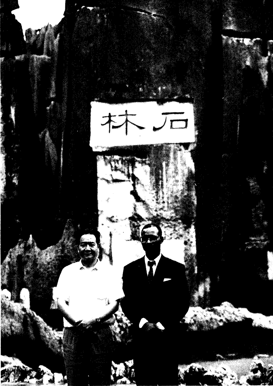
雲南省省長和志强陪同烏幹達總理阿迪耶波游覽石林