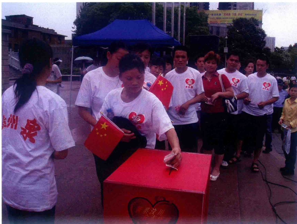
2008年，为灾区人民踊跃捐赠