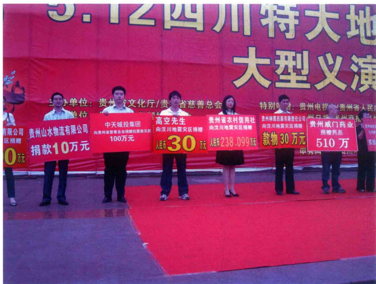
2008年，为地震灾区募集款物1920余万元，图为举行大型义演为地震灾区募捐