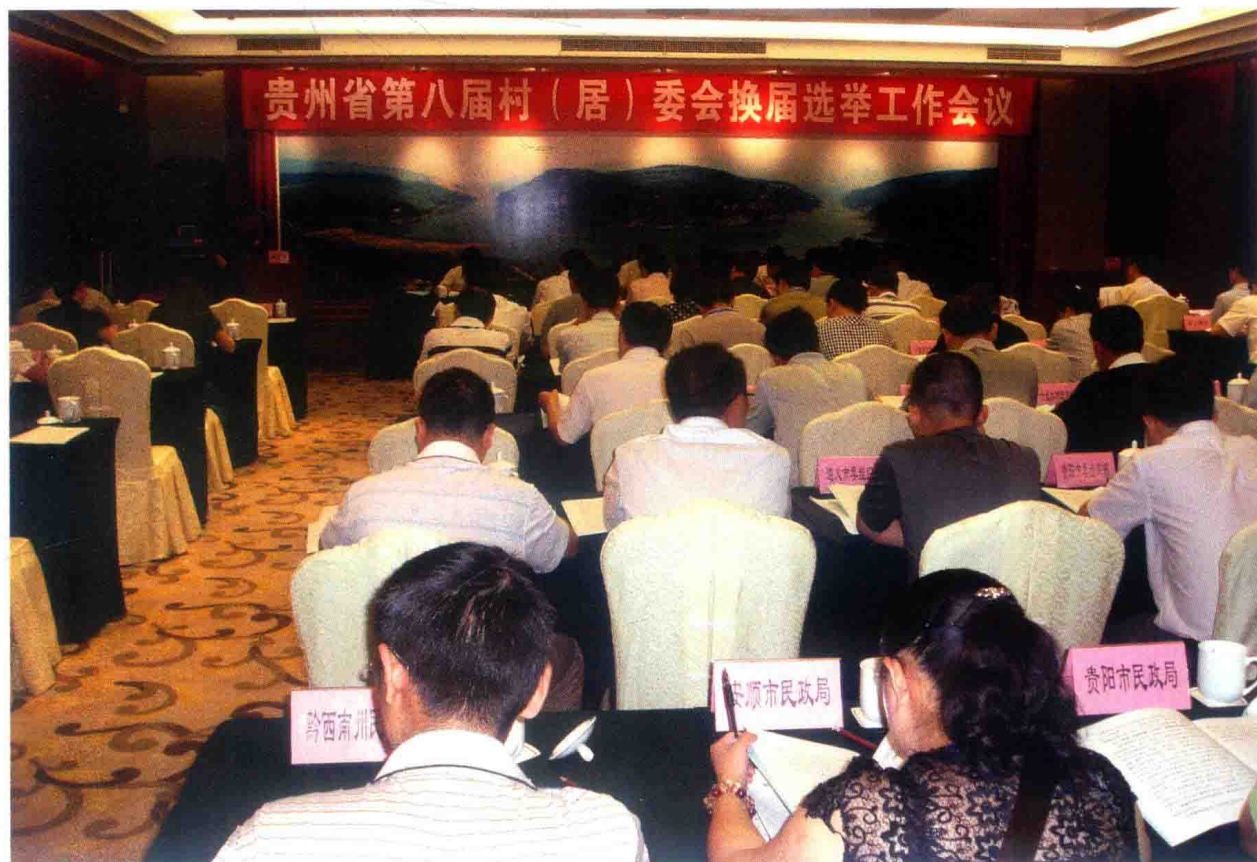
2010年，召开全省第八届村（居）委会换届选举工作会议，对换届选举工作进行动员