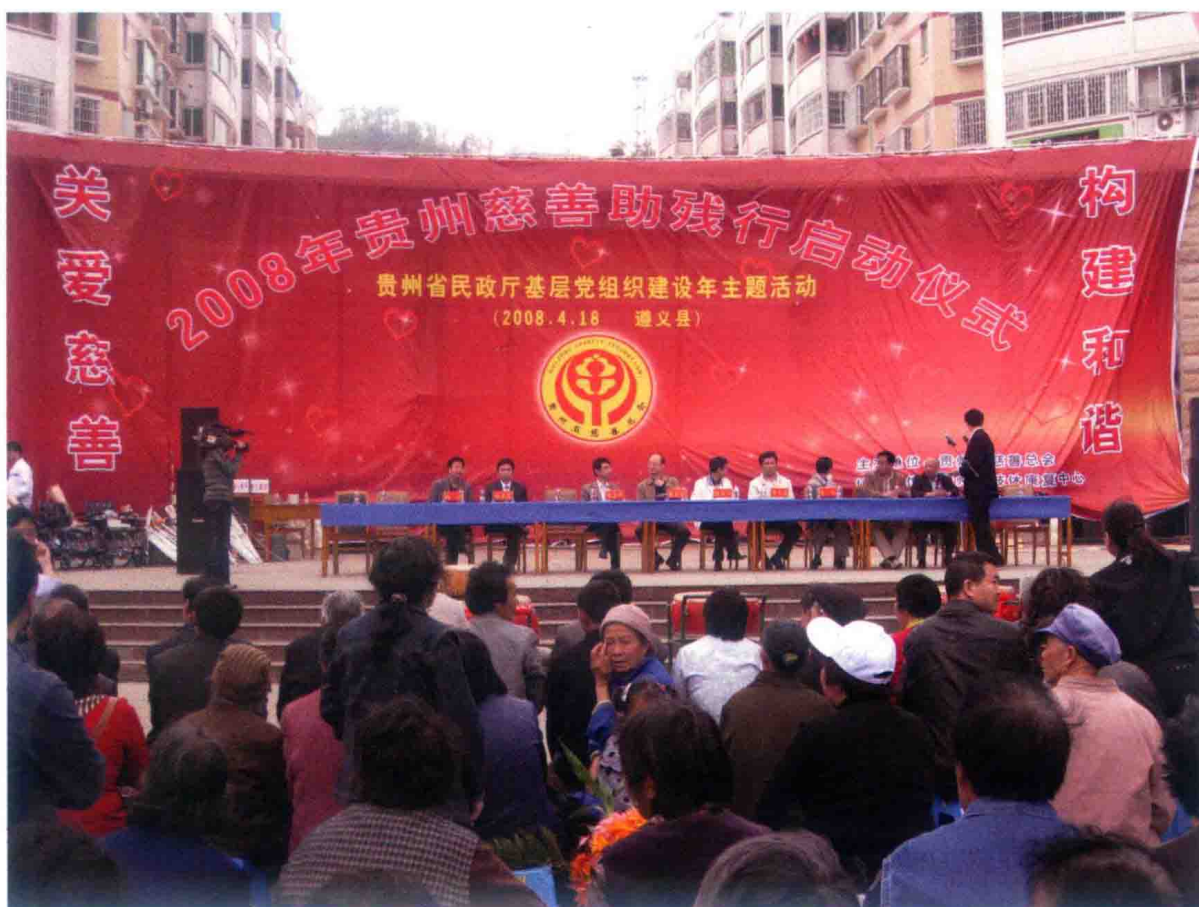
2008年，“慈善助残行”活动现场