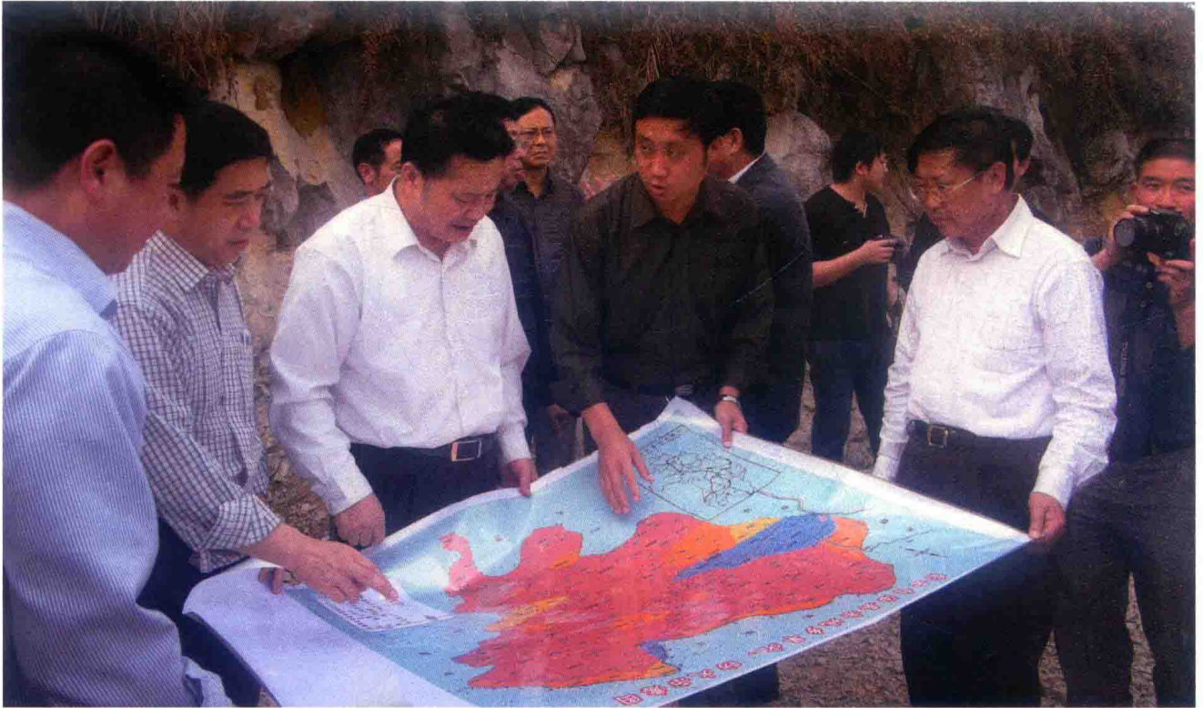
2010年，省政协主席王正福（左三）指导抗旱防火救灾工作