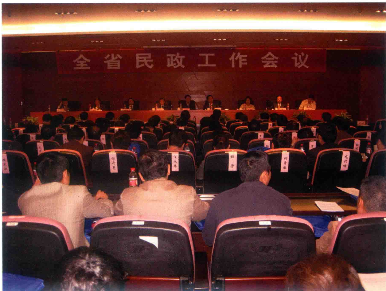
2009年，全省民政工作会议在贵阳召开