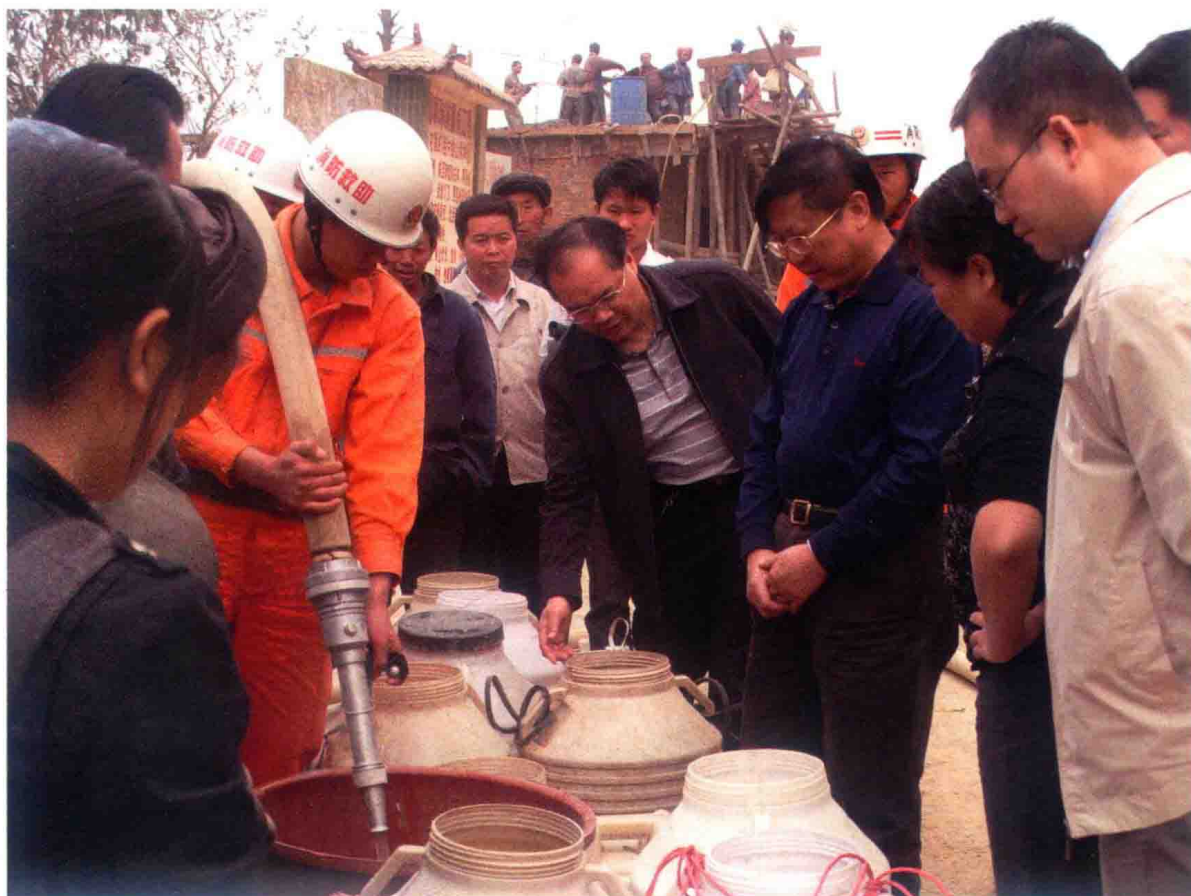
2010年，省民政厅厅长丁治学（右三）到安顺查看灾区送水情况