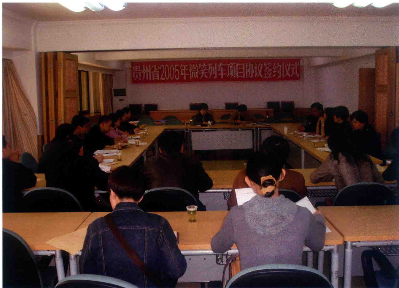
2005年，“微笑列车”项目签约仪式