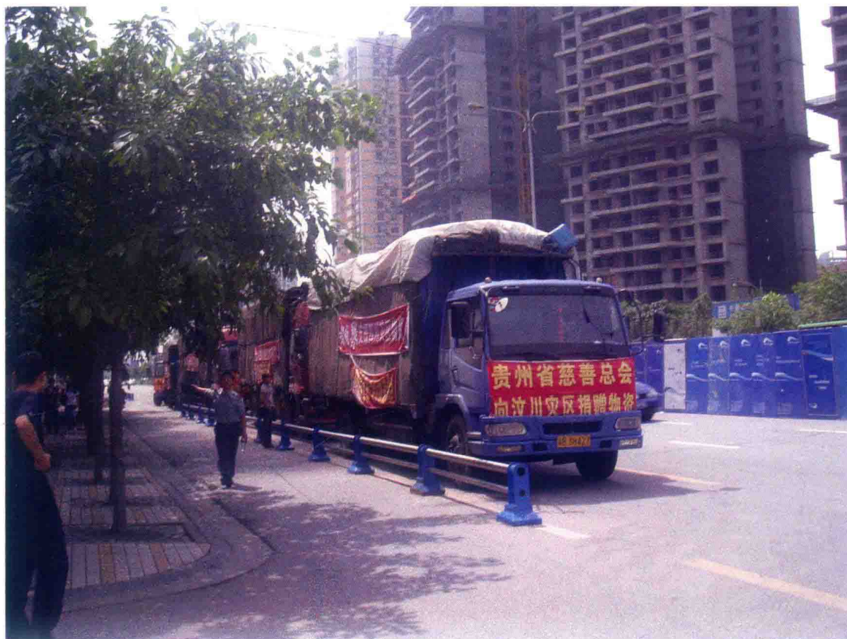
2008年，捐赠物资运达成都