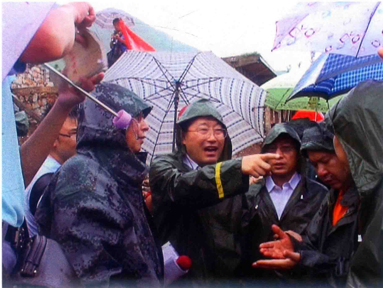
2010年，副省长辛维光（中）在关岭县岗乌镇滑坡现场指挥救灾