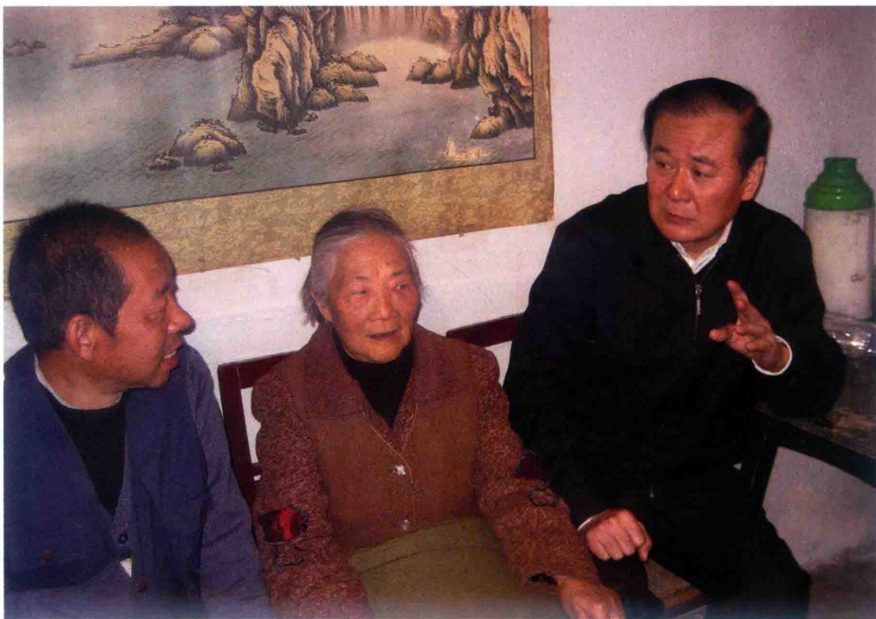
2007年2月13日，省委书记石宗源（右）慰问乌当区低保户周宗福