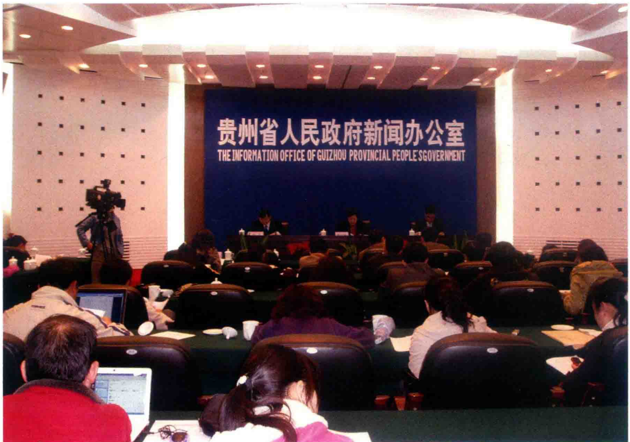
2009年，低保新闻发布会