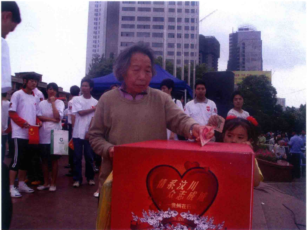
2008年，为地震灾区人民踊跃捐赠