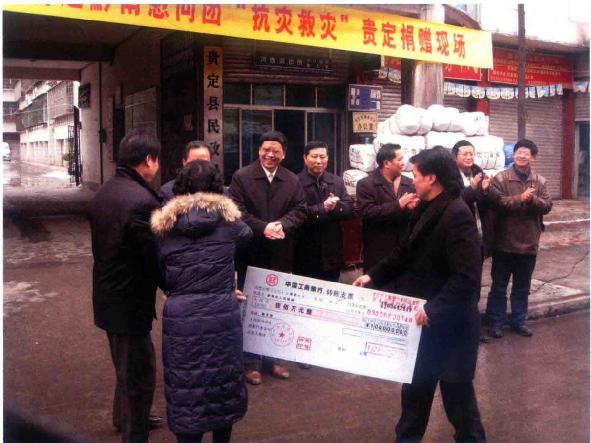
2008年，救灾物资捐赠现场