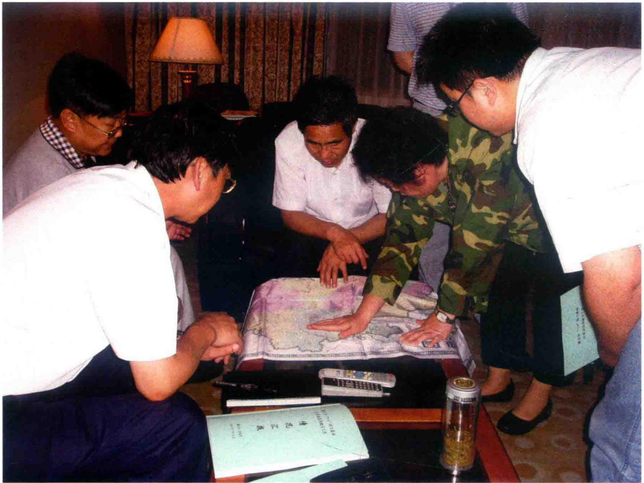
2010年，与民政部工作组彻夜研究灾情