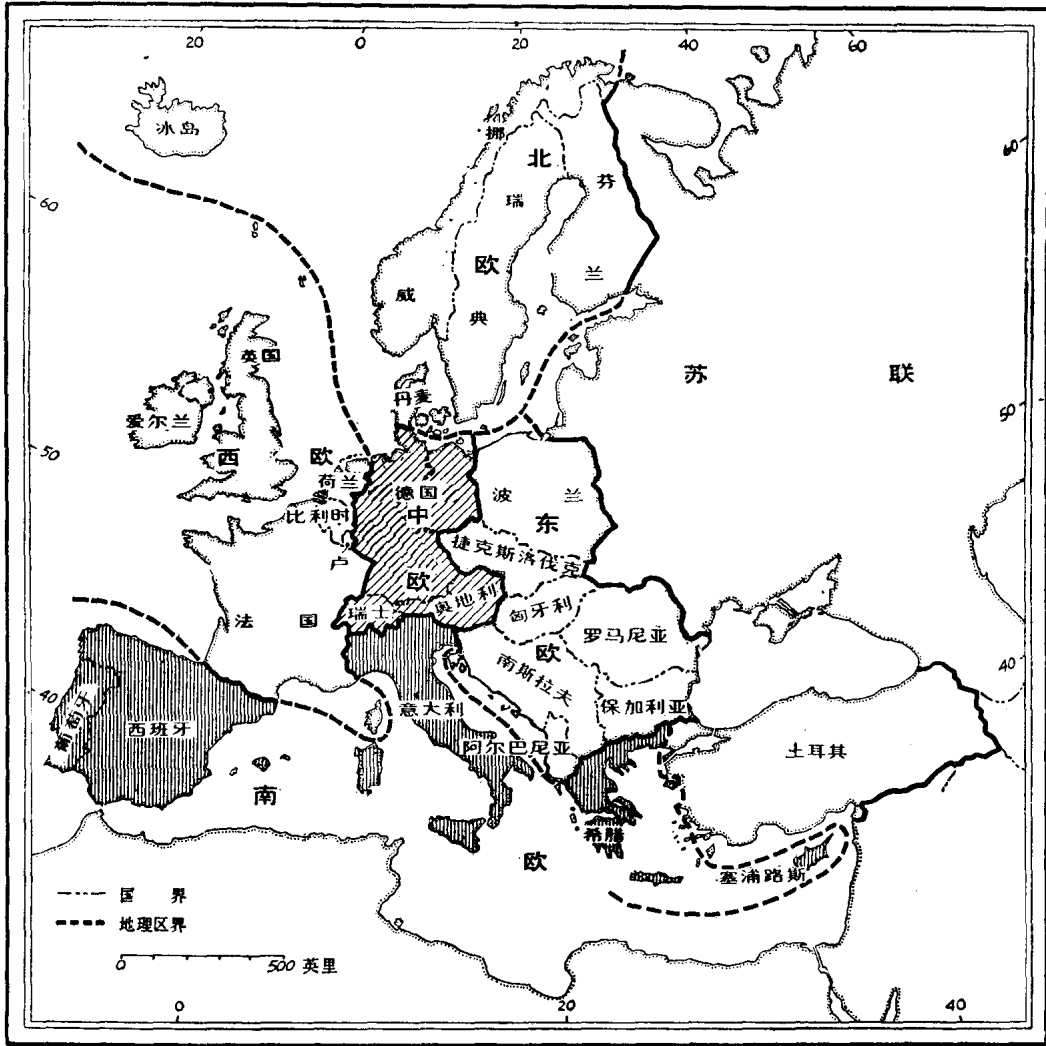
图. 3. 本书中的欧洲主要地理区划