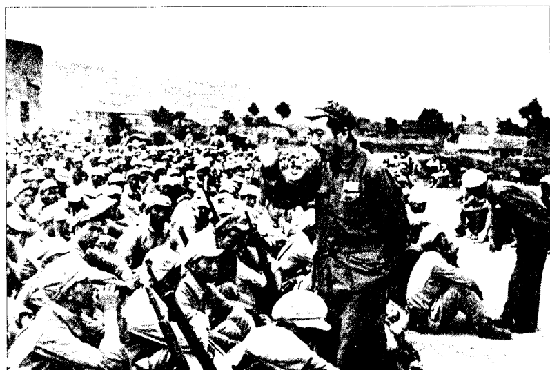
▲王震司令员在攻打宝鸡前，为参战部队作动员。