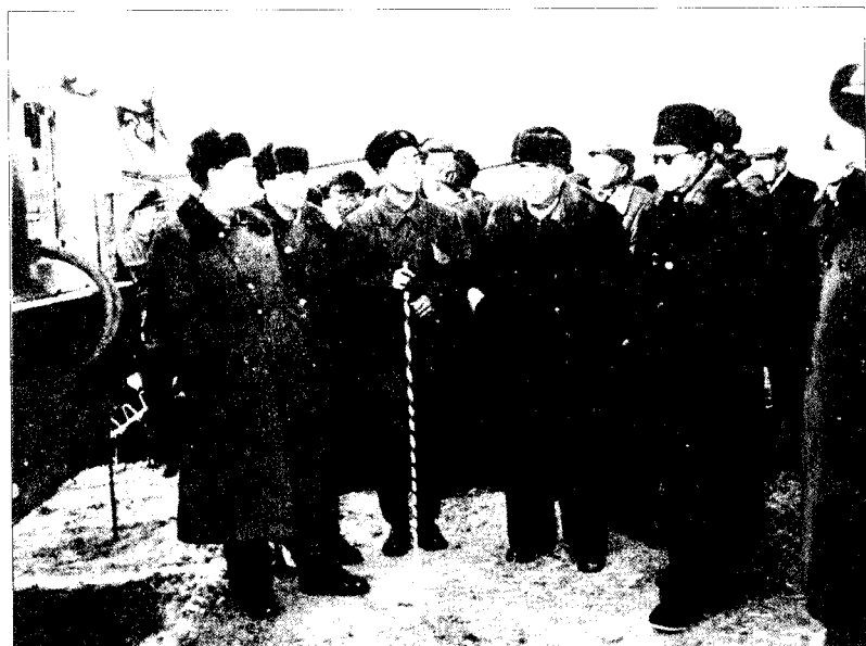
▲许光达(左一)陪同朱德、贺龙等视察第一坦克学校。