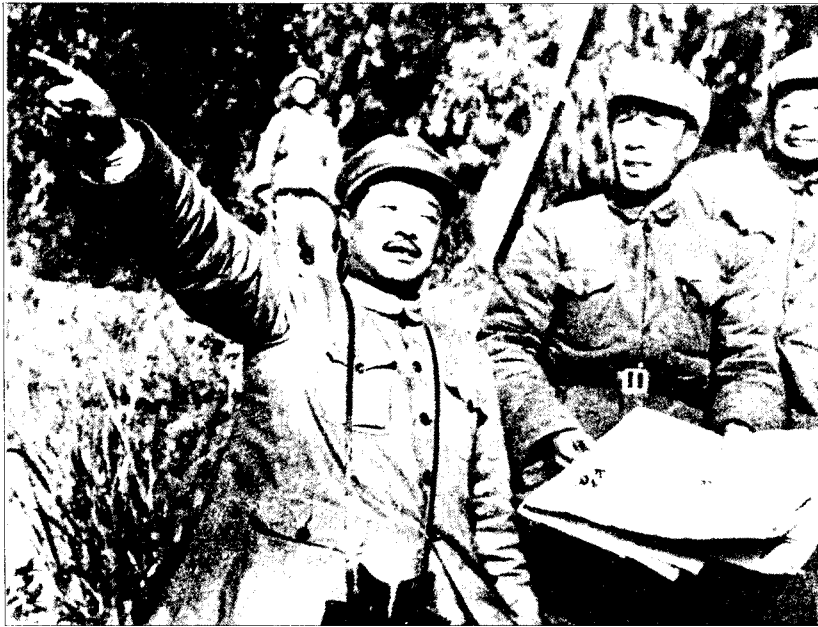
▲1949年11月，18兵团司令员周士第（中）在进军西南中，与贺龙一起研究作战方案。