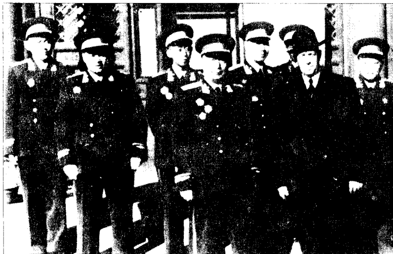
▲1955年10月，郑维山(左三)与北京军区部分领导人一起，同聂荣臻元帅合影。