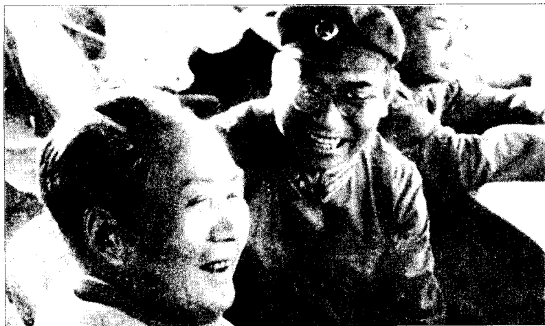
▲1964年6月16日，毛泽东观看装甲兵部队军事表演后，与装甲兵司令员许光达大将交谈。