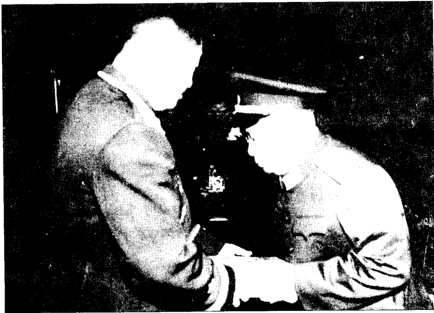
▲ 1955年，贺龙元帅在成都给成都军区司令员贺炳炎授衔授勋。