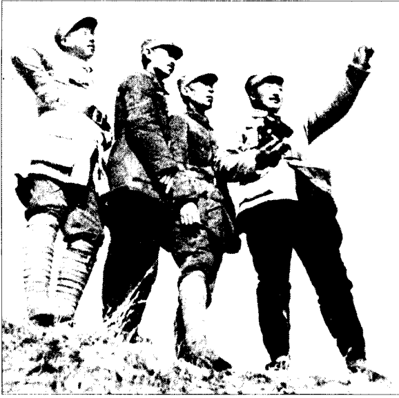
◀周士第（右二）与120师领导贺龙等在雁门关以南，察看伏击日军运输队的地形。