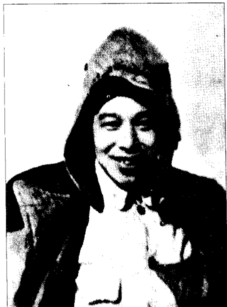
▶1955年12月，时任第一纵队政委的廖汉生率部赴陕甘宁后留影。