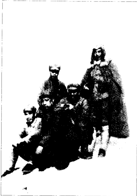
◀1948年初，贺炳炎（左二）与廖汉生（右立者），在攻破的敌堡上留影。