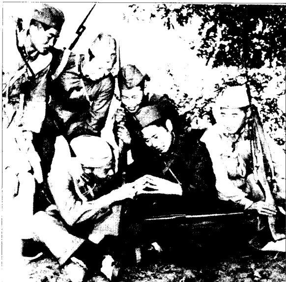
◀下连当兵的杨得志上将和战士们同娱乐。