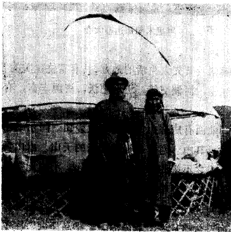
准噶尔蒙古包和牧民

在气势雄伟、绵延不绝的群山里，蕴藏着丰富的宝藏。山区有大片森林，覆盖着茂密的云杉、落叶松和桦树林。在准噶尔盆