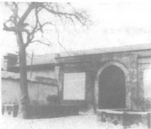
书画家黄养辉纪念张钫先生的题字。