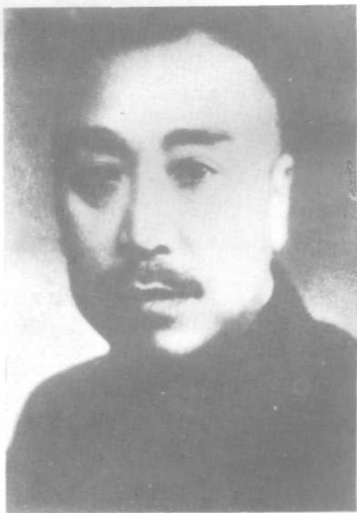
任军事参议院院长时的张钫先生 （抗战时期摄于西安）