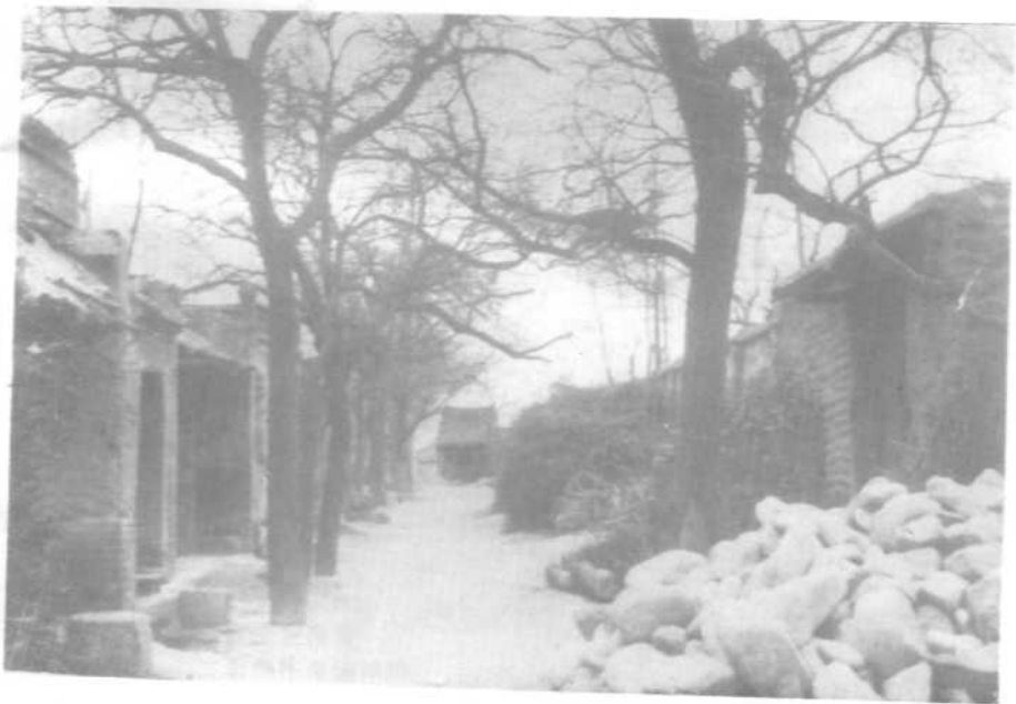
辛亥革命时期泉店村正街旧址。一九一二年二月陕西民军与清军正式谈判前，曾在此街西头的天神庙（照片中顶端独间小屋）接洽和谈。