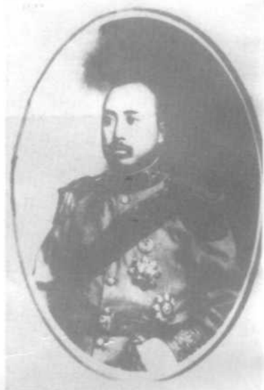
民国初年的张钫先生