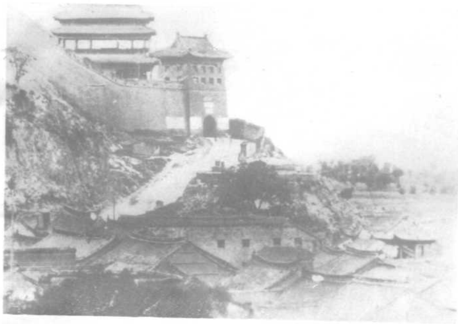
潼关东城门楼外景。（摄于抗日战争爆发前）辛亥革命中，秦陇豫复汉东征军曾与清军激战于此地。