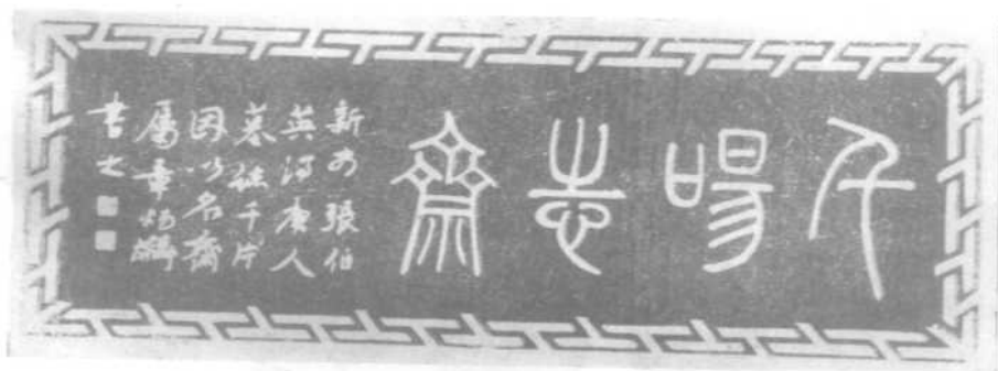
章太炎为张钫别墅蛰庐中所建千唐志斋题的门额