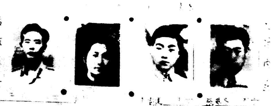
“一二·一”四烈士像 左起：于再、潘琰、李鲁连、张华昌