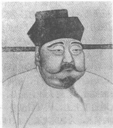
(摹自中国历代帝后像)

匆地离开了人世。然而，在中国封建社会历史中，宋太祖——赵匡胤，已经作为著名的开国君主，留下了引人注目的一页。