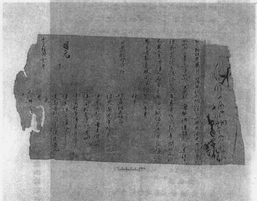
图一 唐开元十九年（公元731年）唐荣买婢市券