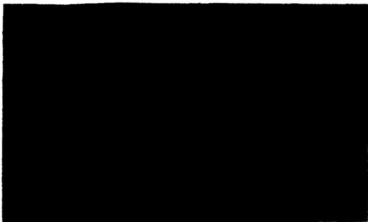
战斗中的蒙古军队

从公元 1219 年开始 ⑦ ，蒙古大军（约有 15—20 万人 ⑧ ）向花刺子模国发起猛攻。在到达讹答刺城后，蒙军分为四路。成吉思汗与幼子拖雷率一军，直取不花刺城。其长子术赤率