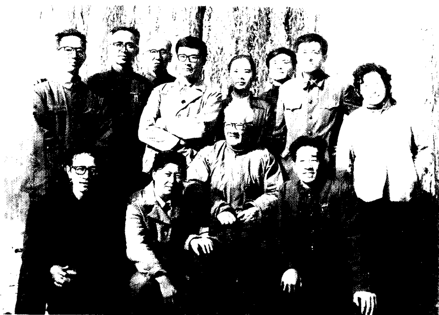
八十年代与北京大学哲学系部分师生在一起