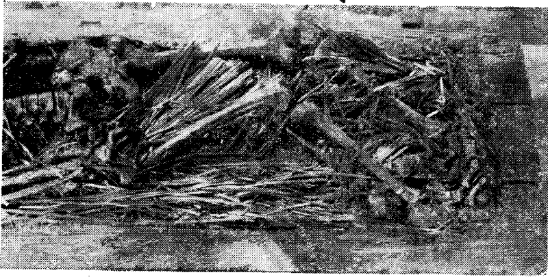
图二 睡虎地十一号墓棺内竹简出土情况（棺下部）

保存较好，字迹清晰，只有少数残断。这批秦简经科学保护，细心整理拼复后，总计有简一千一百五十五支（另残片八十片），内容计有下列十种：