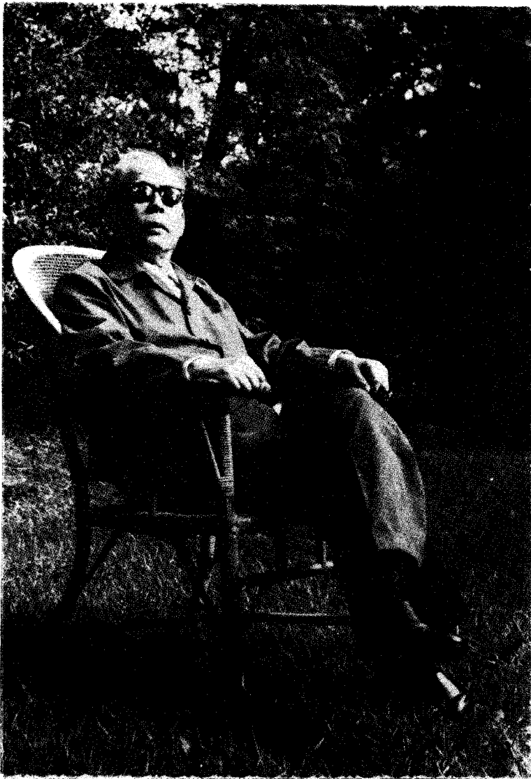
周谷城教授（摄于1980年）