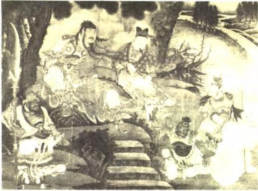
关羽擒将图 · 明·商喜