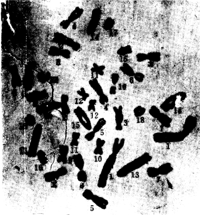
内江母猪染色体组：2n = 19 对