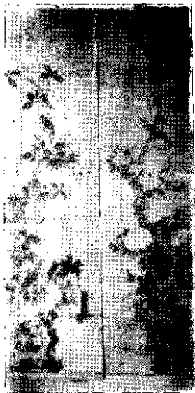
丁翰熙的山水花巧画