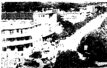
图一 灵城街道一瞥