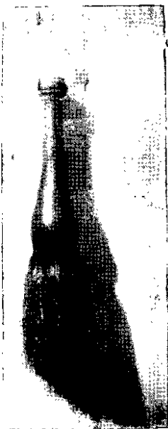
丁翰熙当年书法用的 斗 笔