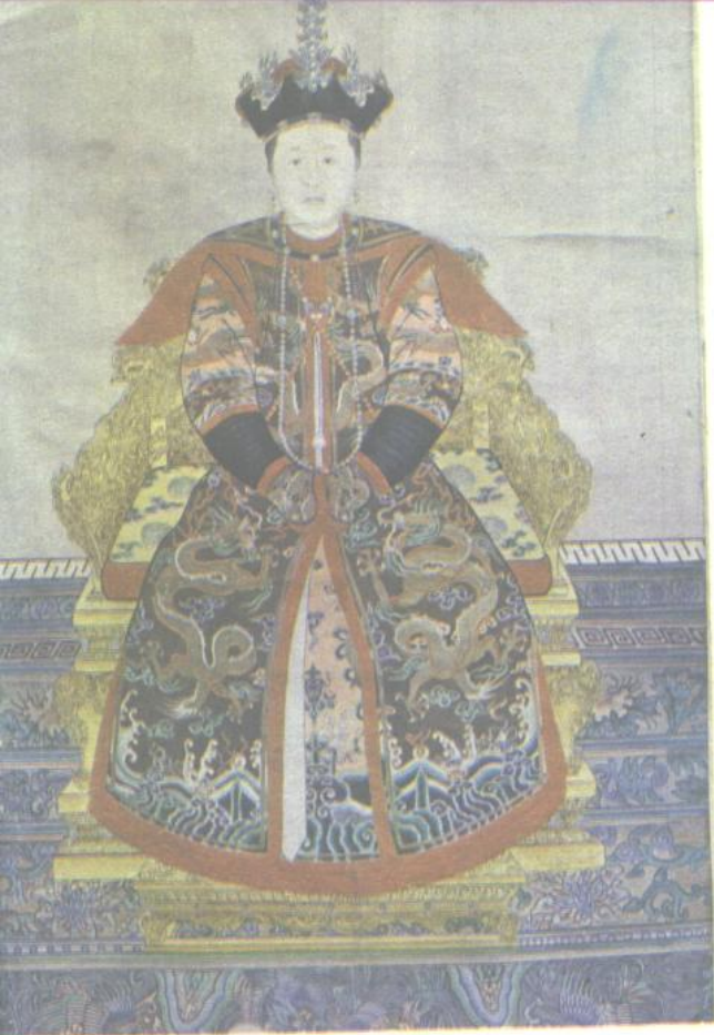
20. 清孝庄文皇后朝冠、朝褂、朝珠坐像