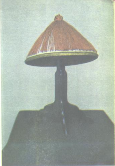
8. 滿族貴族男子涼帽