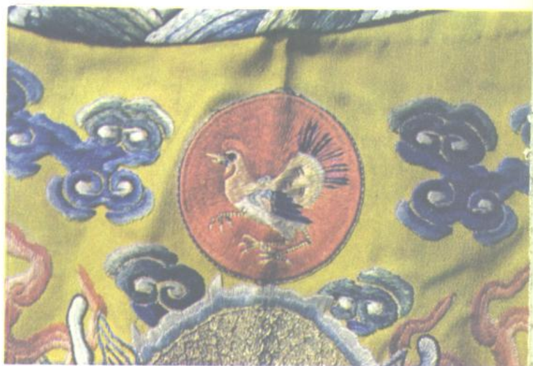
17. 十二章纹饰图 日