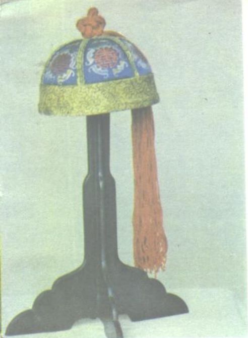
7. 带有“红纓”的男便帽