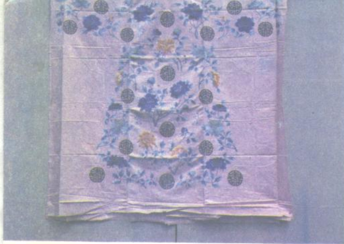
16. 粉地彩绣万寿 富贵纹衣料