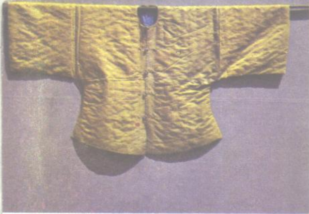
10. 清朝皇帝行褂黄马褂