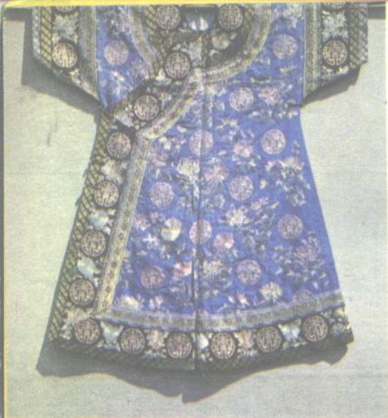
4. 蓝地宁绸绣金寿字挽袖 女夹袍