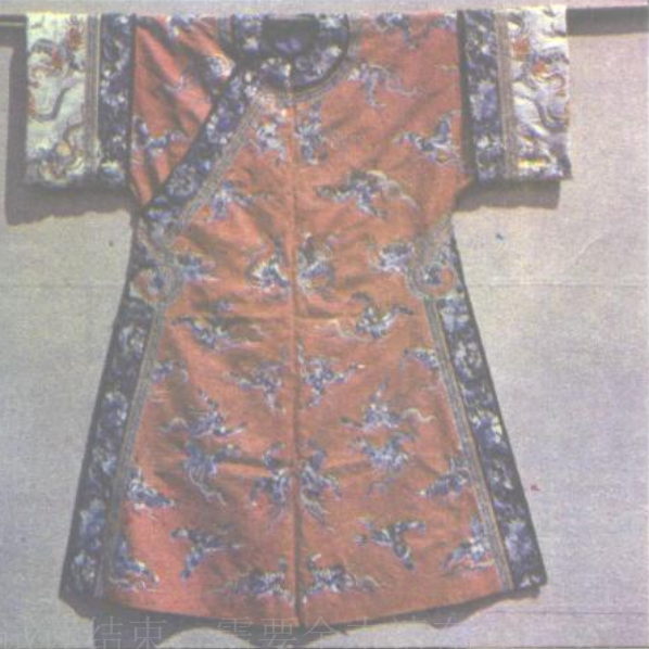
3. 大红宁绸彩绣挽袖女夹袍