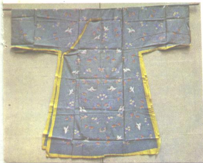
15. 绿地缙丝翔鹤水仙纹衣料