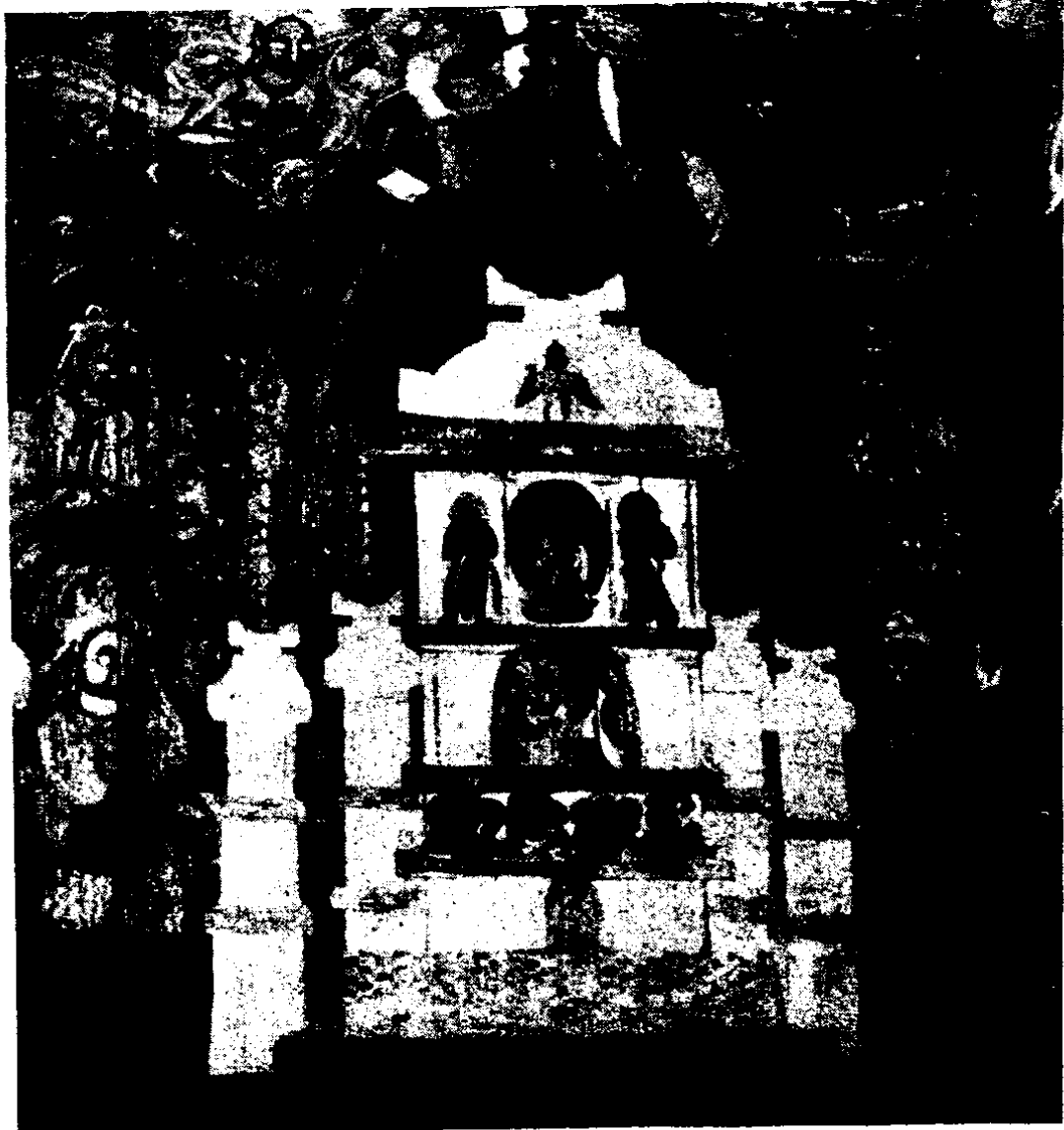
敦煌壁画中的金刚宝座塔

煌莫高窟二八五窟内壁画中的金刚宝座塔，是北周时期的作品，也是现在所知最早的我国两个金刚宝座式塔的形象之一。另外一个原山西朔县崇福寺内所存的北魏兴安元年（454年）的小石刻塔。从壁画上我们可以看出，塔下是一个方形台座，台上分立五塔，中间一塔特别高大，四隅塔很小。刹上均有相轮七重，刹顶冠以宝珠。此外，在山西朔县崇福寺旧址，北魏兴安二年（455年）的石刻小塔和五台南禅寺唐代石刻小塔，也都具有这种塔的意味。但崇福寺塔的四角小塔很不清楚，只是写意而已，而敦煌壁画中的金刚宝座与现存实物非常相似。