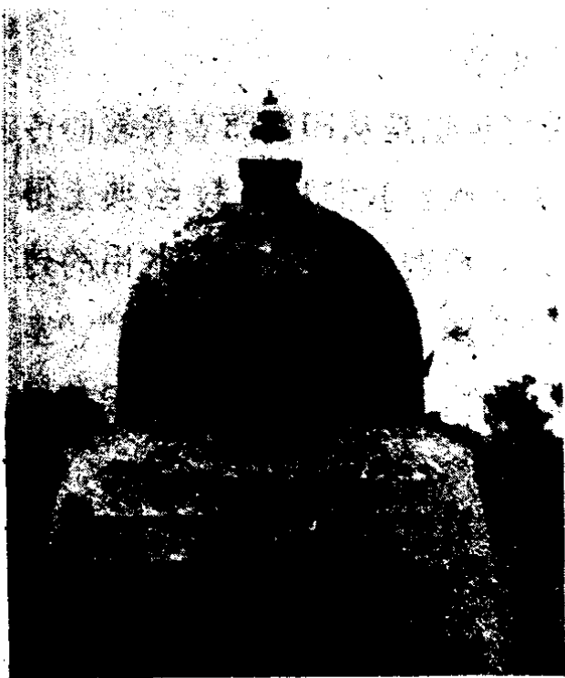
印度释迦涅槃处窣堵波

塔的梵文是坟墓的意思。当塔传到中国来的时候，印度的塔已经过了较长的发展时期，除了坟墓之外，还有在灵庙石窟内建造或雕刻的塔。译成中文的时候，各家所译各式各样，