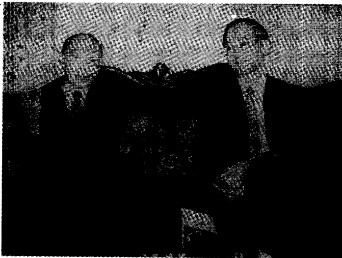
霍英东(左)向宁有明介绍历届华商大会情况

经叔平说,近五年来,在中国对外贸易和外商对华直接投资中,亚洲国家和地区所占的比例,已分别达到 62% 和 66%。1996 年中国进出口贸易总额达 2899 亿美元,居世界第 11 位;在国内吸纳的 1700 多亿美元的投资中,就有半数以上为海外华商所投。到 2000 年,预计中国进出口贸易总额将达到 4000 亿美元,对外经济技术交流与合作将会进一步扩大,中国已向世界开放了一个巨大的市场。这是任何有远见的企业家和商界人士都不该错失的良机。