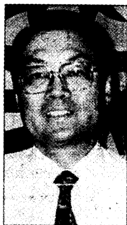
宏碁集团董事长施振荣

在华商大会 27 日一个早餐会上,数百位华商听取花旗银行开发中心的电脑科学家潘伯仁介绍称为“智慧卡”的新式电子购物工具。此卡可储存卡主的个人资料,比如指纹等,令人无从盗用;使用“智慧卡”时不用与信用卡公司联系便能结账,在极为偏远的店铺亦能使用,很是方便。这种卡在日本、香港及新加坡等地已开始流通,年底又会在美国纽约市推出。