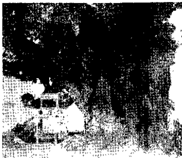
新圩乡邓家村的千年荔枝古树。