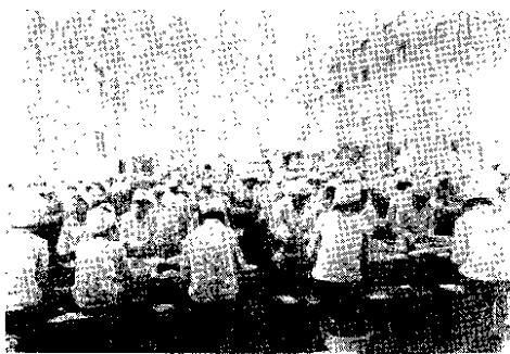
图为县罐头厂工人在加工荔枝罐头。