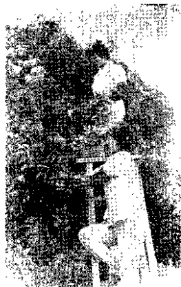
龙武农场的职工在采摘荔枝。