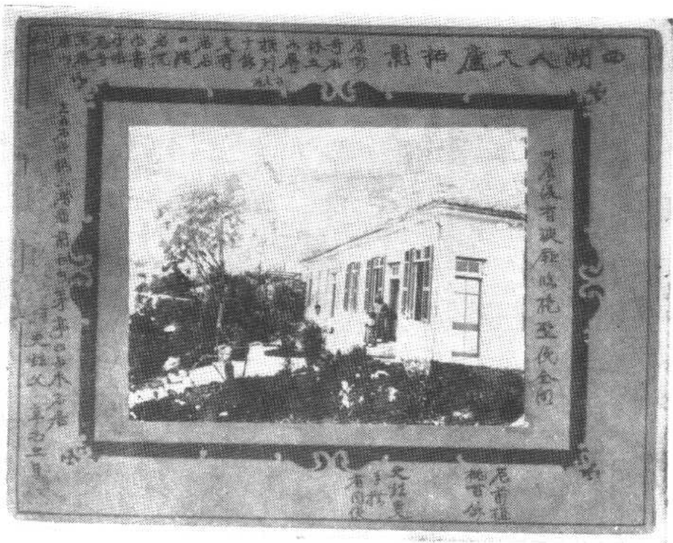
康有为在西湖人天庐住宅(一九二一年四月摄于杭州)