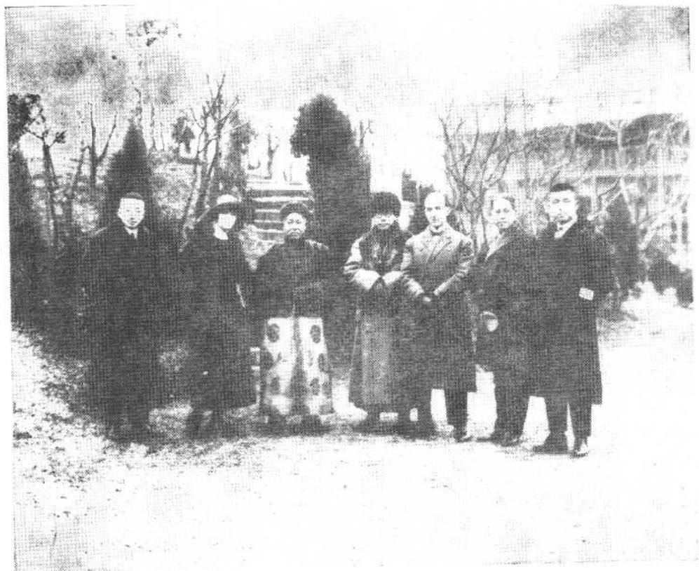
康有为与友人摄于原上海愚园路住宅