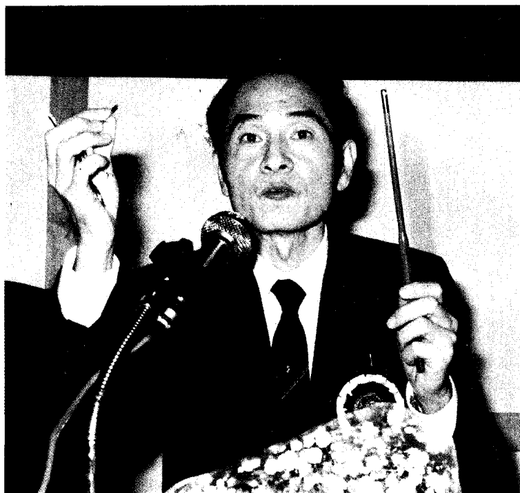
作者1987年在香港講學