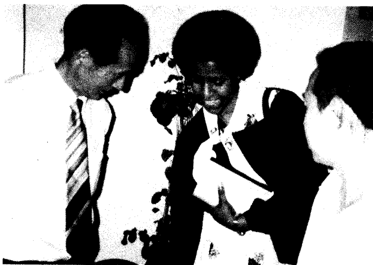
非洲醫生1987年在香港學習刺激神經療法