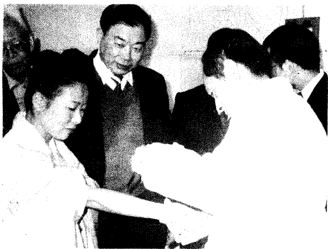
日本醫學代表團一九八五年 在深圳學習刺激神經療法。