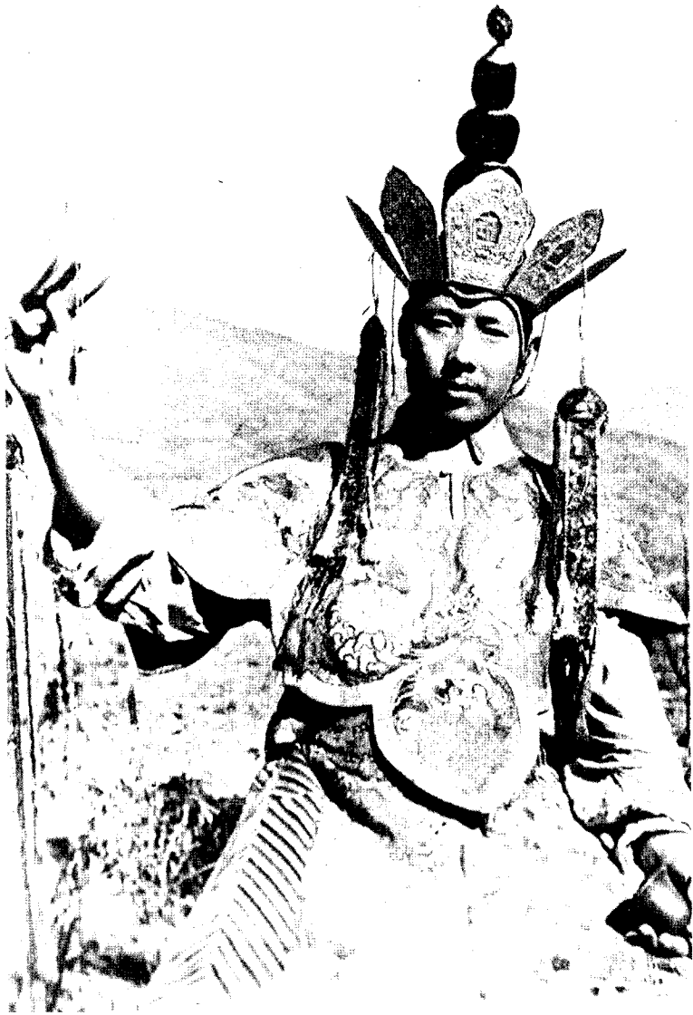
宁玛派活佛齐美仁增