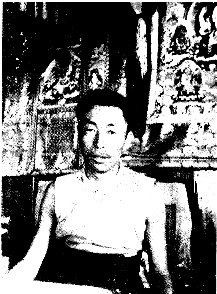
格魯派活佛達多仁波且