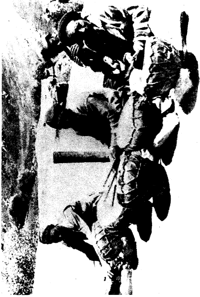
在结婚仪式上敲鼓的拉达克黑铁匠