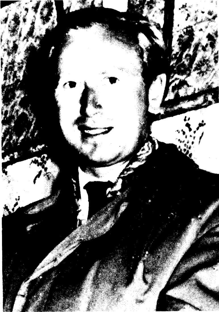
勒内·德·内贝斯基·沃杰科维茨