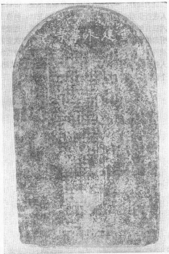
《重建永宁寺碑记》(1433 年立)