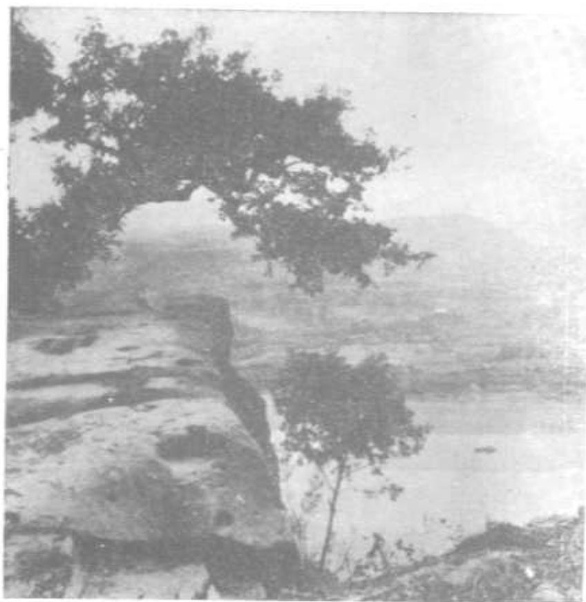
钓鱼山上的钓鱼台