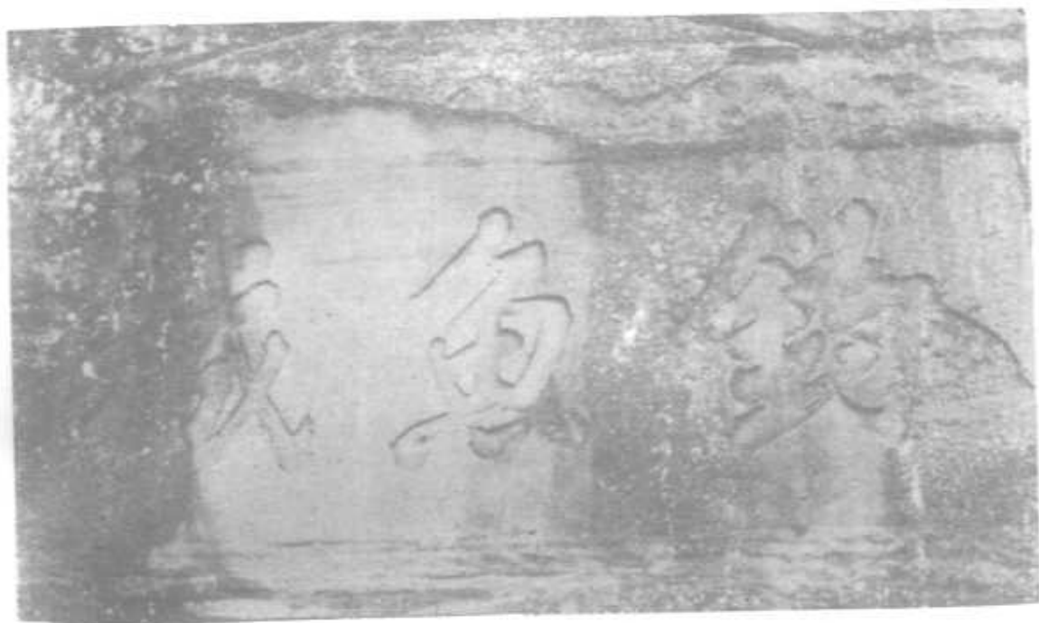
清乾隆庚子孟秋会稽沈怀璠书题 在钓鱼山护国门外岩壁上的“钓鱼城”