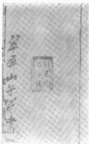
上左：“百本張”鈔本戳記