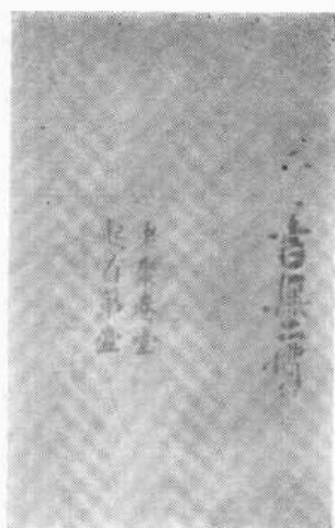
上右：“老聚卷堂”鈔本戳記