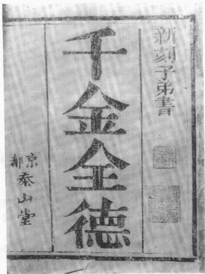
泰山堂刻本《千金全德》题叶