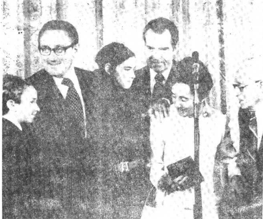
一九七三年九月二十二日，基辛格在白宫宣誓就任美国国务卿时，带领父母、儿女同尼克松总统合影。