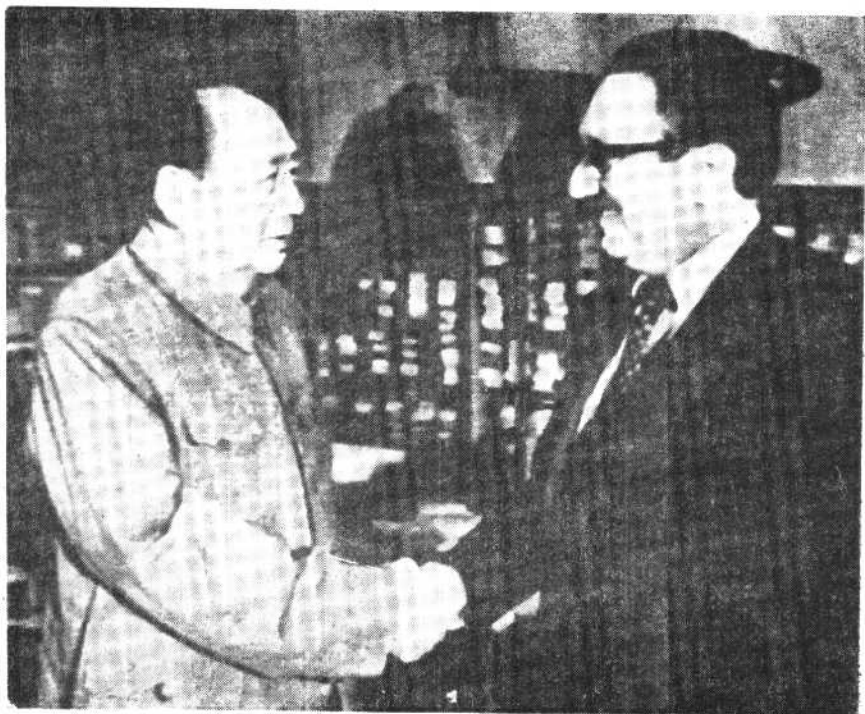
基辛格会见毛泽东主席。