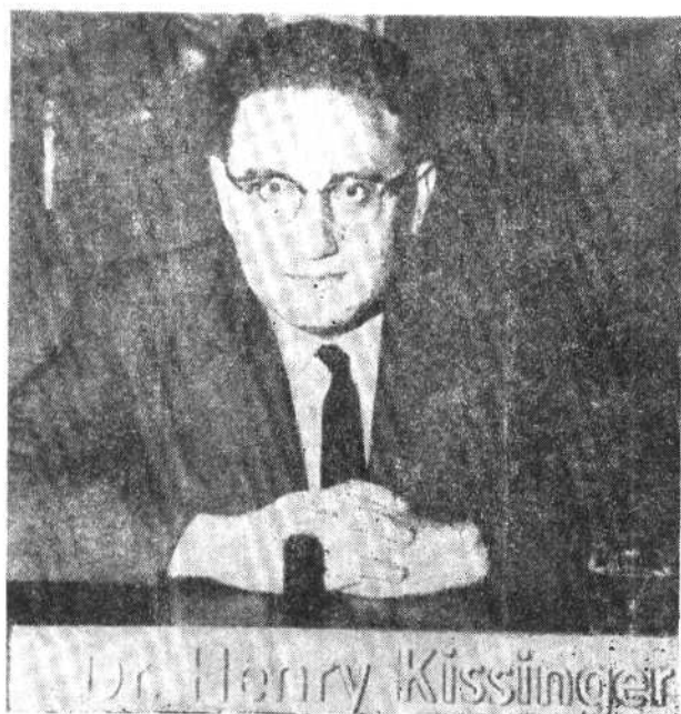
一九五七年的 哈佛大学讲师 亨利·基辛格。