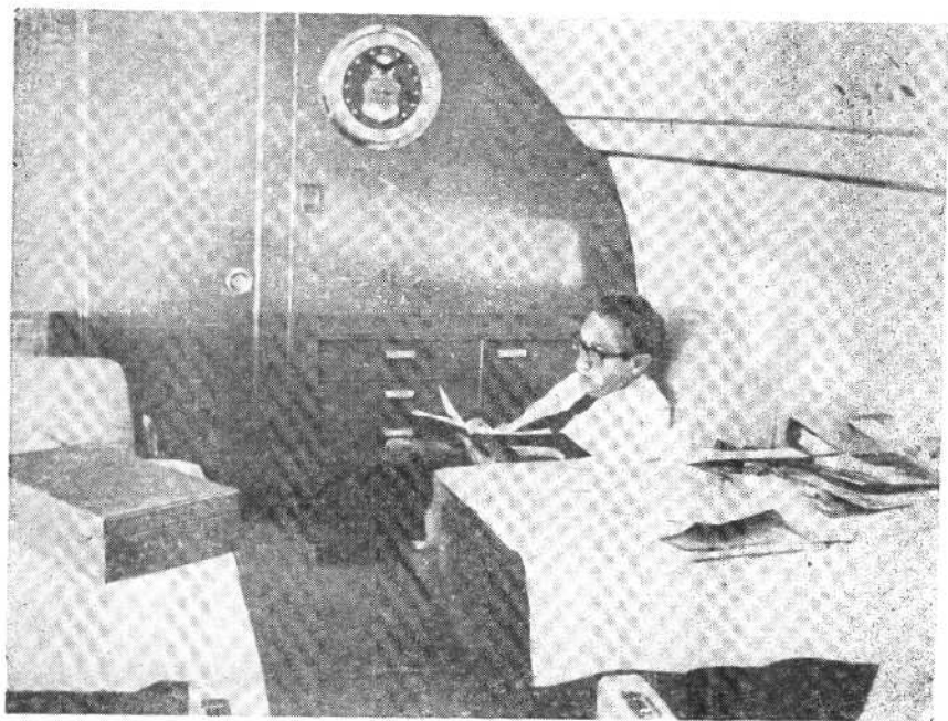
基辛格在飞机上办公。