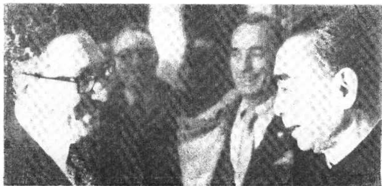
基辛格同周恩来总理谈话。