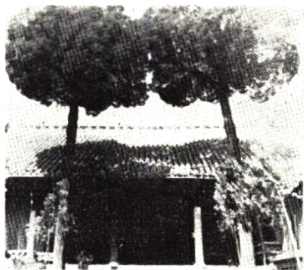
太和清真古寺大殿