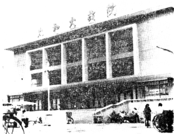
1983年建成的太和大戏院