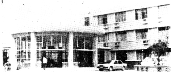
1984年建成的太和宾馆