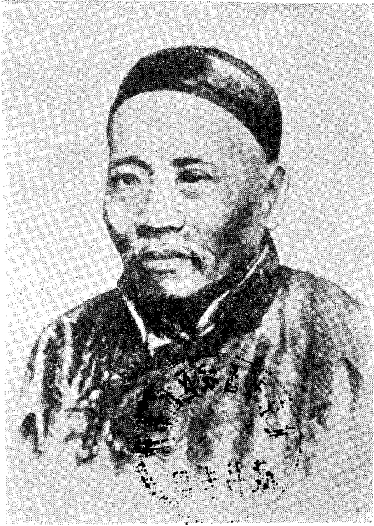
上图：王韬像。（封面图片：十九世纪中叶的伦敦大学。）