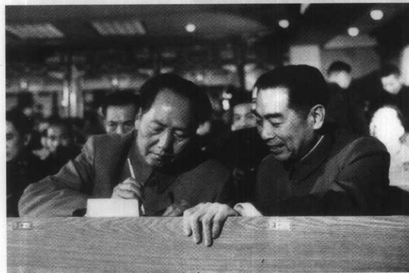
一届人大一次会议上，毛泽东在写选票。

1954年6月25日至28日，周恩来应邀访问印度，与印度总理尼赫鲁（左3）举行了会谈。4月29日，中印两国签订《关于中国西藏地方和印度之间的通商和交通协定》，协定提出了处理两国之间关系的五项原则：互相尊重领土主权；互不侵犯；互不干涉内政；平等互利；和平共处。