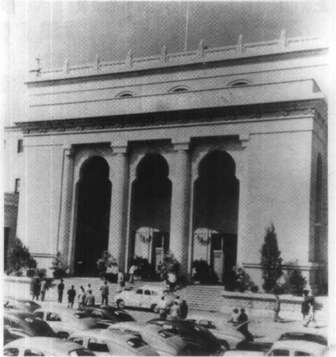
出席中共八大的代表步入会场。

1956年，中共提出的“百花齊放、百家爭鳴”方針在全國知識界引起很大反響。圖為《光明日報》刊載的《科學家、教授談“百家爭鳴”》。