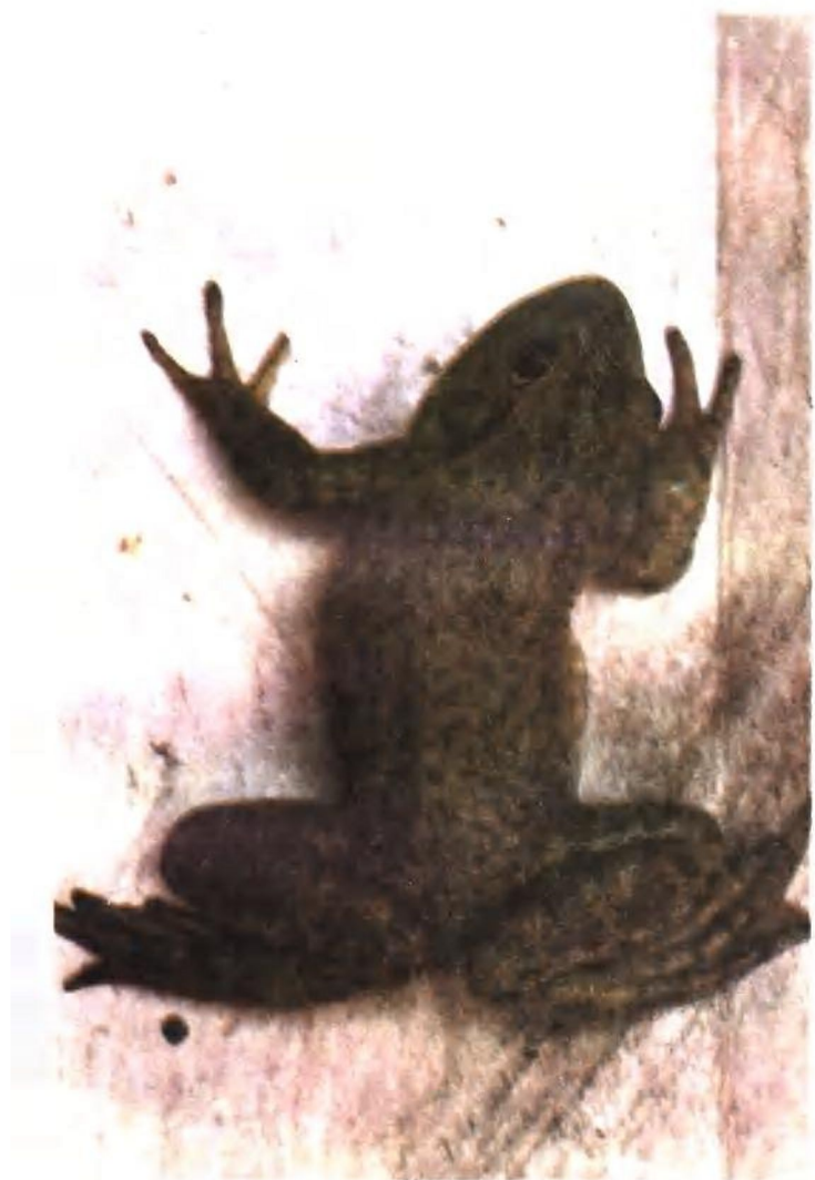
图版六：牛蛙旋转病 蛙体歪斜