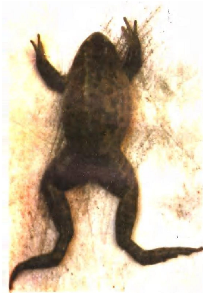
图版四：传染性肝病 1 背面观