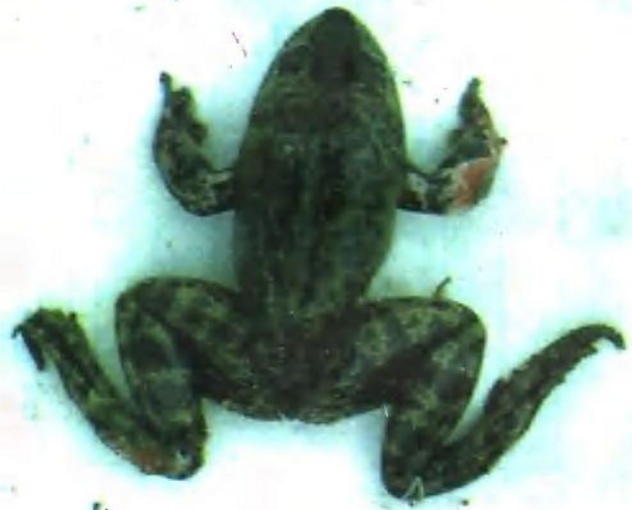
图版二：牛蛙烂皮病