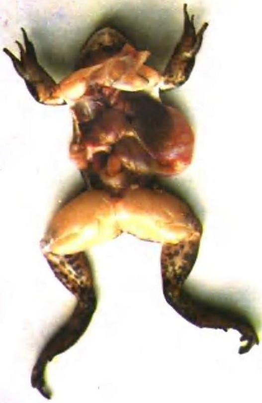
图版四：3 内脏变化 肌肉感染