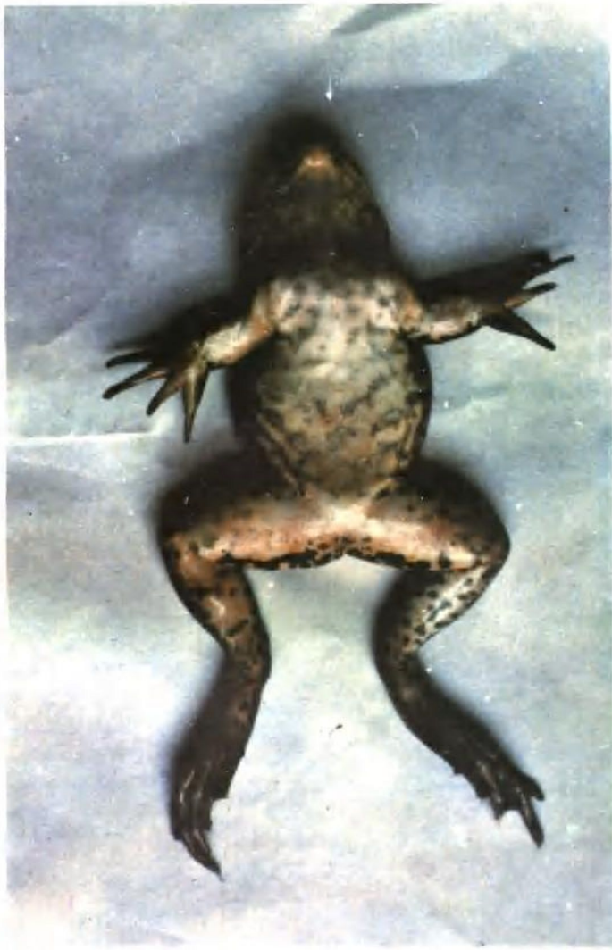
图版一：牛蛙红腿病