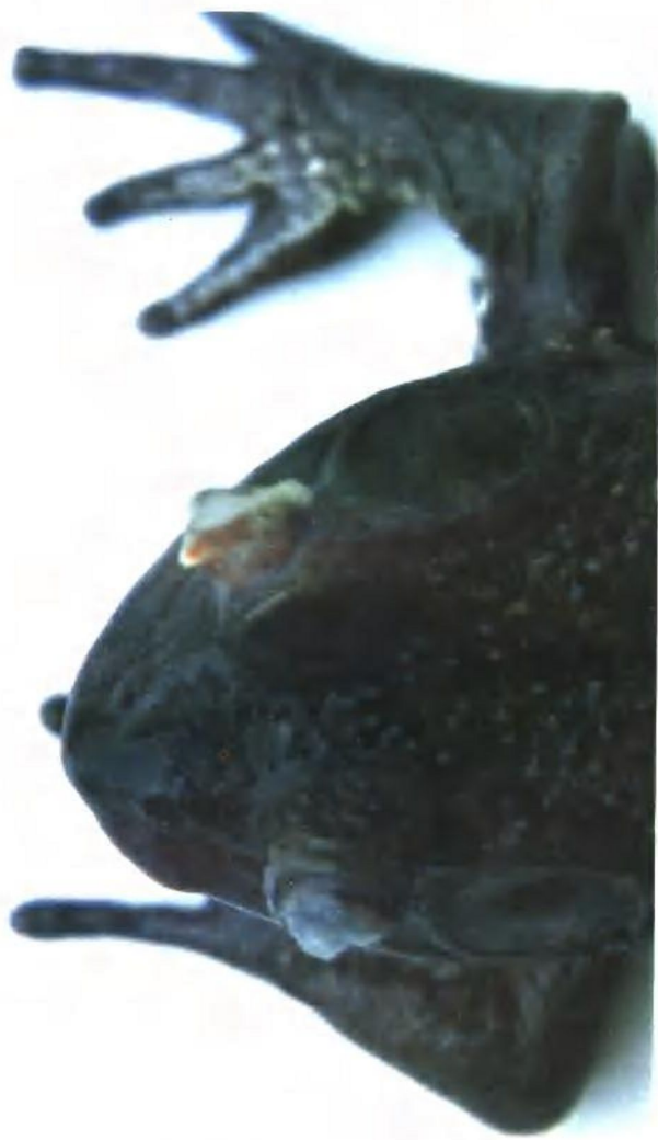
图版三：牛蛙双目失眠 指抓患处出前