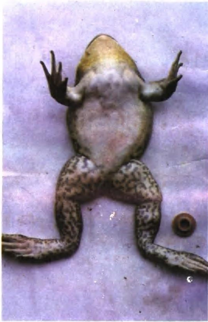
图版九：骨增生变形伴发肿腿病