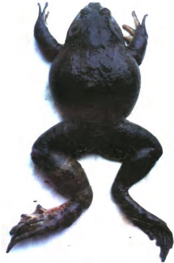
圖版五：腫腿病 1. 背面視