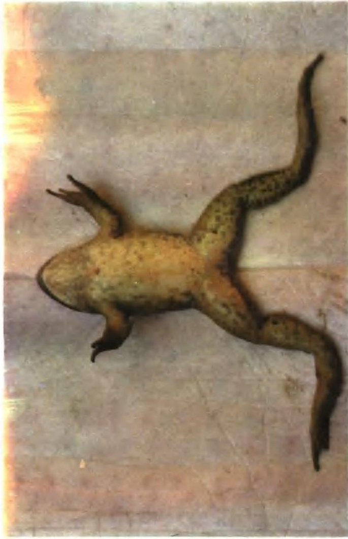
图版四： 2. 腹面观