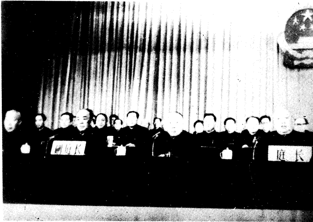
▲ 1980年11月，江华院长任庭长的最高人民法院特别法庭开庭审判林彪、江青反革命集团案。