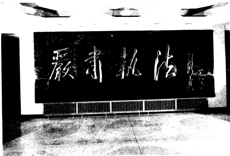
▲ 彭真委员长为最高人民法院办公楼落成题词。