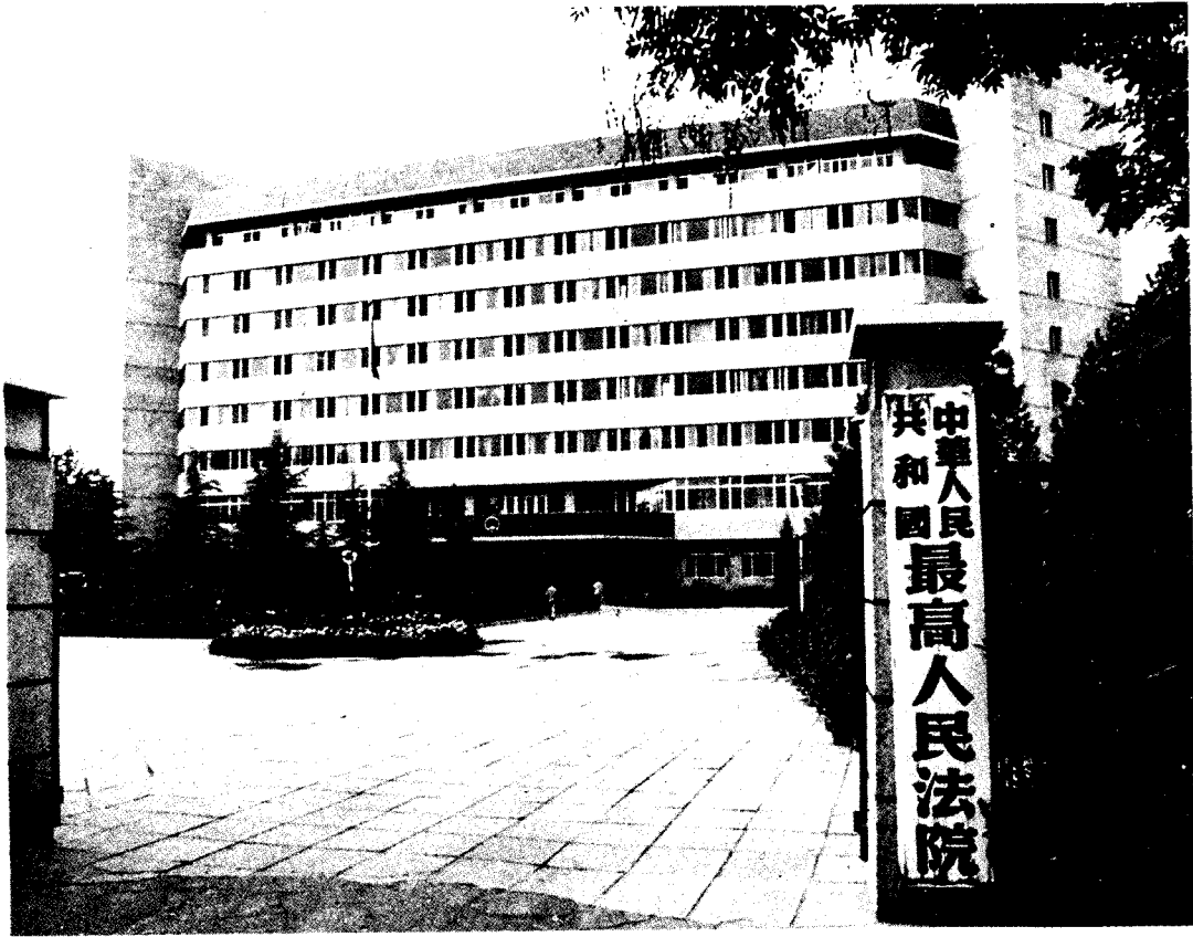
▲ 位于北京市东交民巷27号的中华人民共和国最高人民法院。