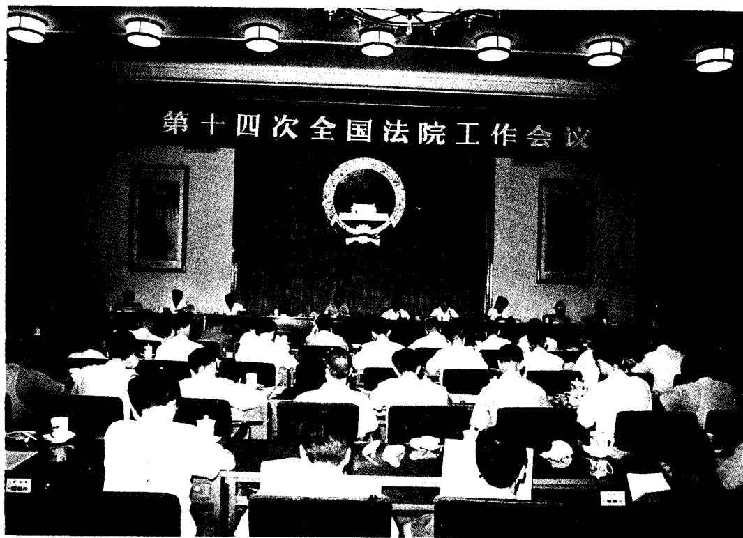
▲ 1988年7月第十四次全国法院工作会议在北京人民大会堂开幕。