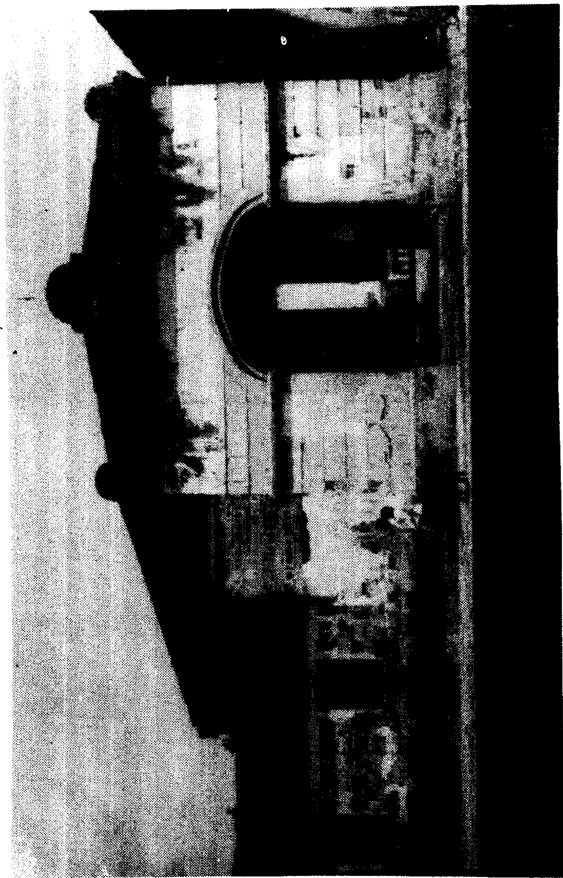
抗日陣亡烈士鄭作民將軍故居