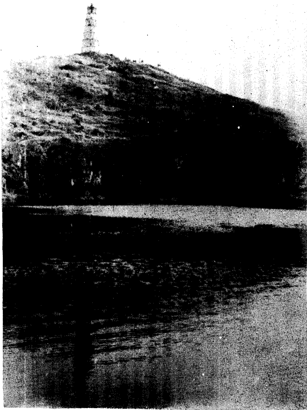
新田八景之一——珠砂夜月