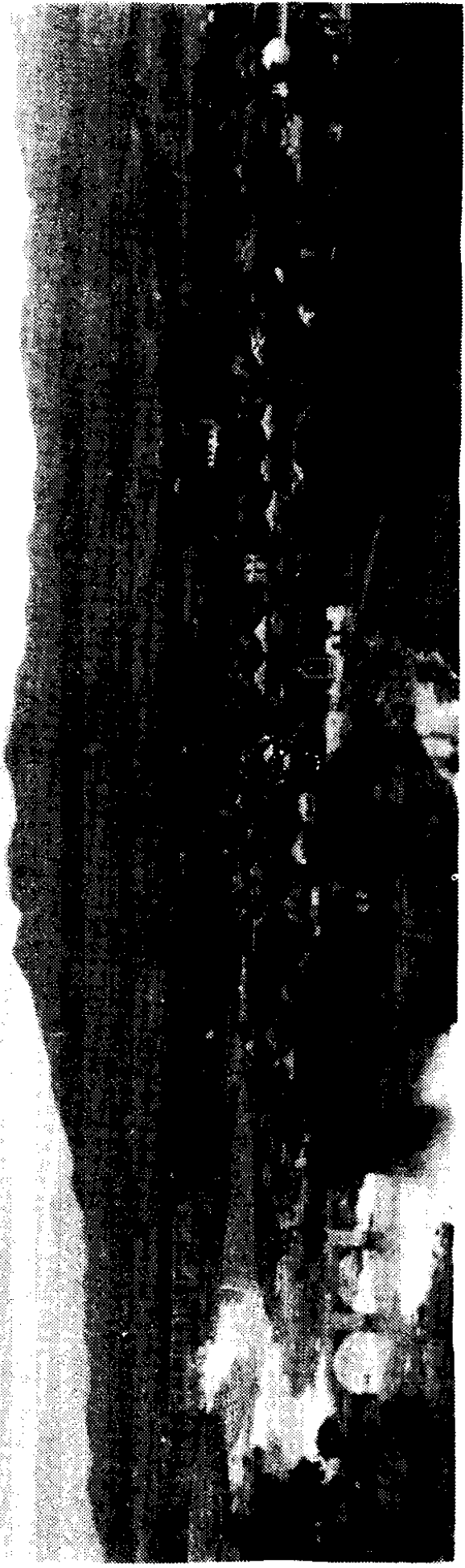
二十年前——1969年新田城全貌