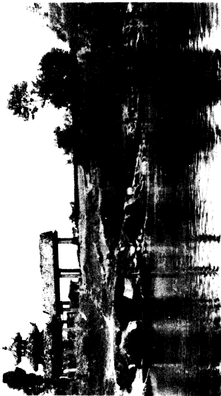
胜利渡纪念碑所在地