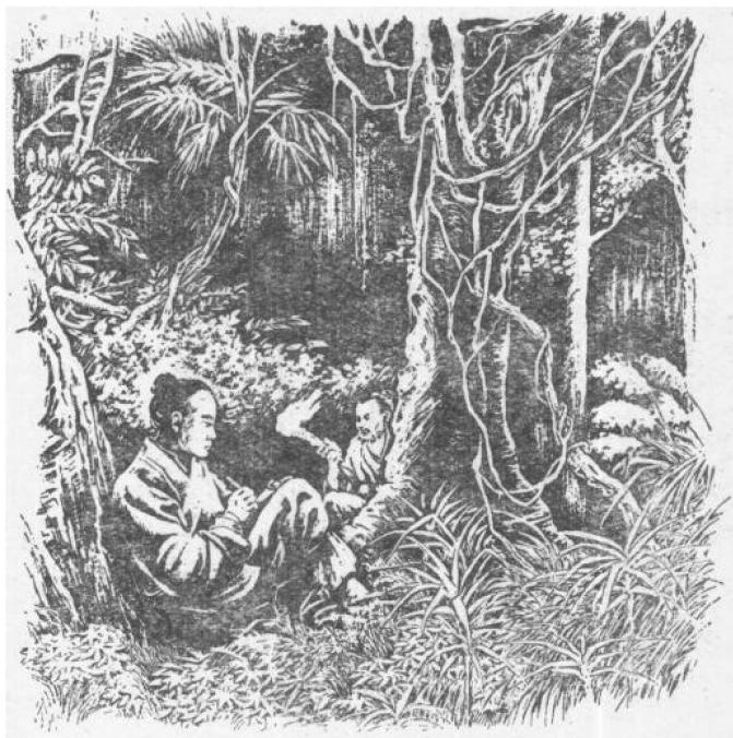
在露宿山野时，燃枯草当灯，记下当天游历和观察的情况

整理，是更加值得重视的。没有作过野外考察工作的人，很难认识到这些逐日的记录得来之不易，然而即使是习惯于野外工作的人，也不能不承认在那样困难的条件下，作出这些记录是需要多么坚强的意志和多么巨大的毅力。霞客出游，主要是依靠自己徒步跋涉，而他所到的地方，又多是一般人的足迹所不至。登危崖、