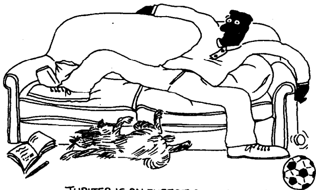
JUPITER IS AN EXPERT AT SPRAWLING

● 跟着我们进入木星人的起居室。我们撞见乔舒亚正舒舒服服地靠在长沙发上，四肢大张，占满了整只沙发，男生往往是这方面的专家，很难想象别的生物能占据这么大的空间，就是木星狗也不能做到。这会儿，乔舒亚看电视直播的足球比赛正看到兴头上，偏巧这时候，他妈妈走了进来。