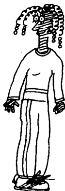
GIRL FROM SATURN ( 'SATURN' )