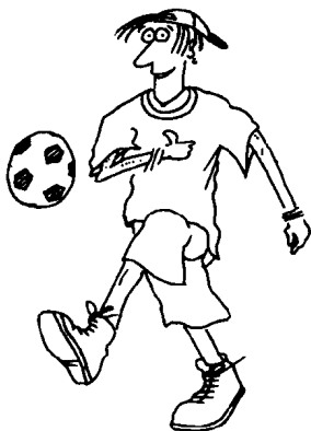
BOY FROM JUPITER ( 'JUPITER' )

(THE GIRLS FROM SATURN WILL FREQUENTLY BE REFERRED TO AS 'SATURN' THROUGHOUT THIS BOOK)