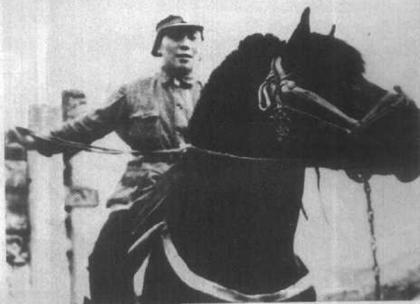
一九三九年摄于延安