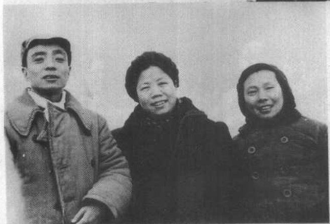
抗日战争时期与邓颖超(中) 杨尚昆摄于延安。