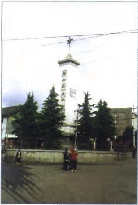
昭觉县革命烈士纪念塔