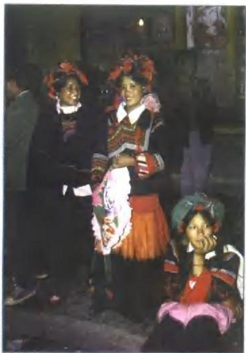
参加火把节的盛装彝族姑娘