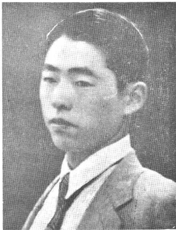
郑律成18岁时摄于上海