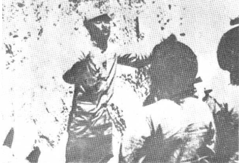
1939年郑律成在延安抗日军政大学指挥唱歌