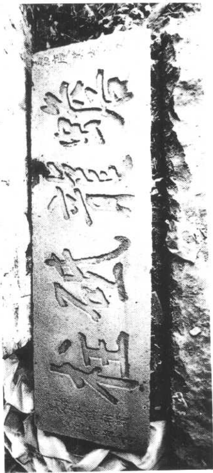
“蟾龙砥柱”石额(清·宋湘书)