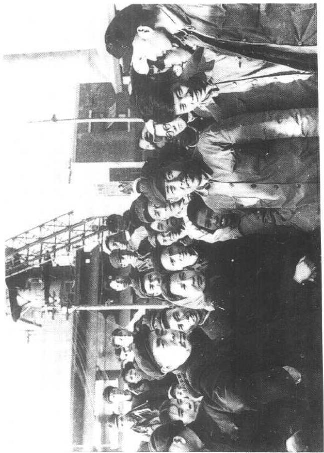
周恩来总理视察广州钢铁厂（一九五九年一月十三日）