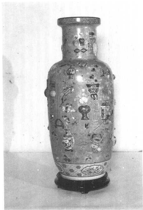
稀世珍品：事件花卉。曾荣获中国工艺美术 优秀作品奖。现为日本恩巴株式会社收藏。