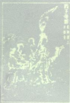
百子卷四 冥府冥司