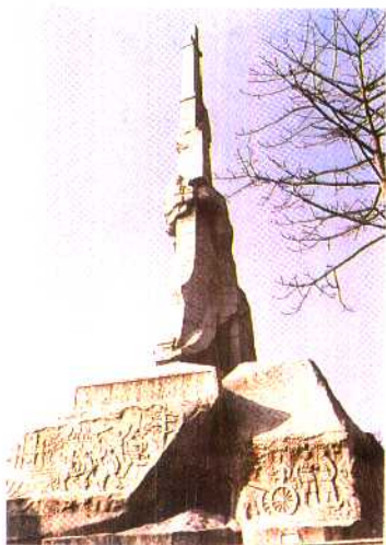
广州起义纪念碑 尹积昌