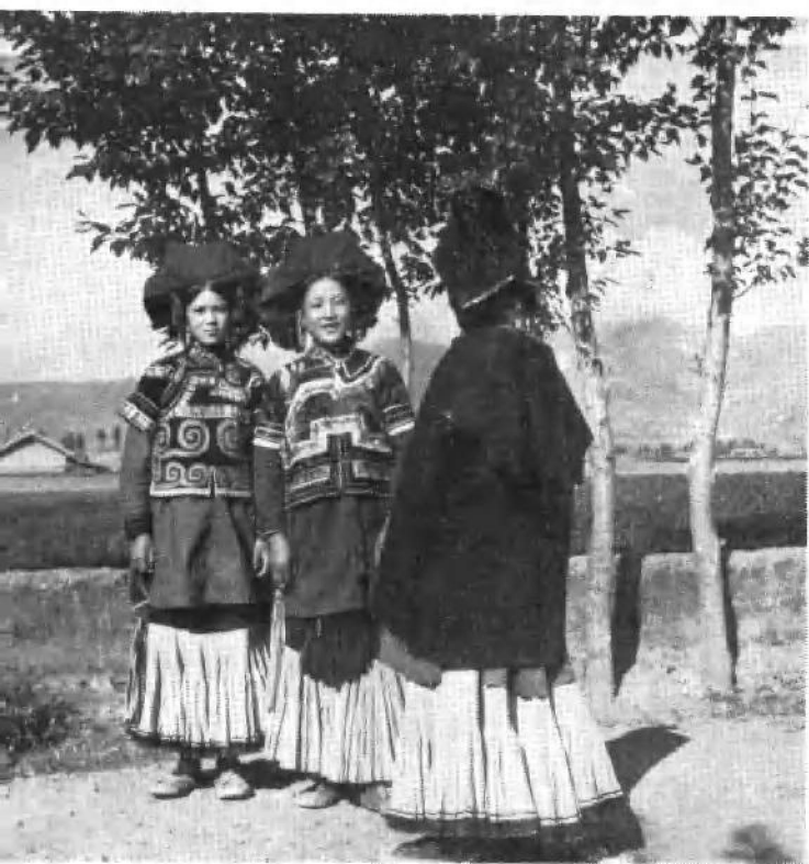
布托县解放后彝族妇女服饰