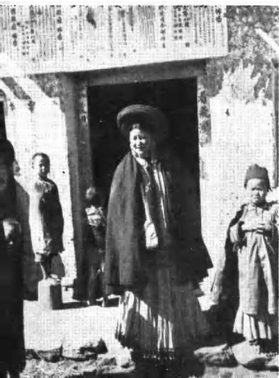
诺合女奴隶主和她的小呷西奴隶