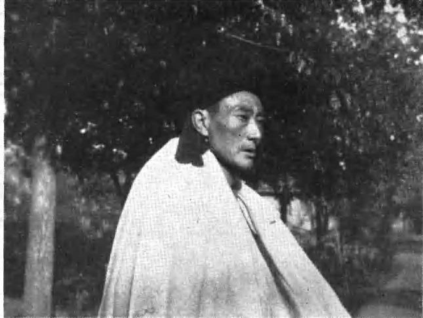
最高等级奴隶主兹莫