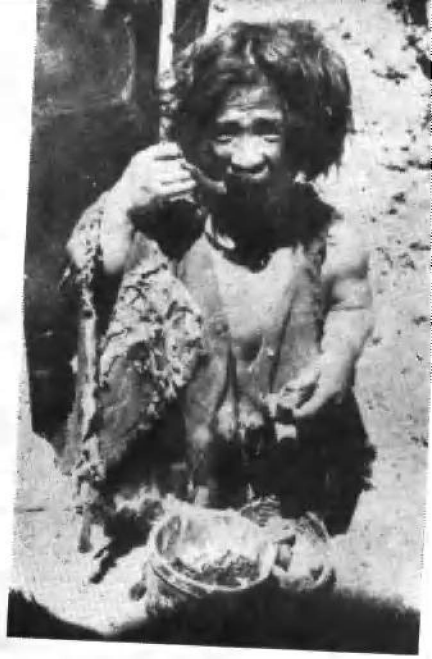
最低等级奴隶呷西