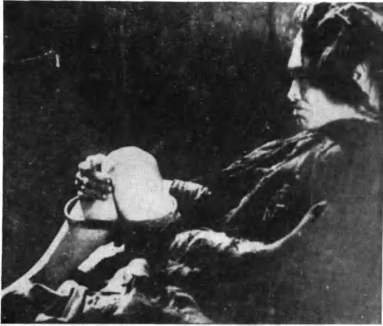
被奴隶主锁住的呷西奴隶